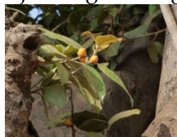
Gambar 3. Hariara

Benda ini berbentuk lonjong dan kecil, berwarna putih, dan berfungsi sebagai makanan pokok. Kehadirannya dalam hidangan sehari-hari sangat penting, memberikan kontribusi utama dalam asupan gizi dan energi. Dengan bentuknya yang sederhana, ia menjadi bagian integral dari berbagai masakan.