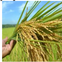
Gambar 2. Eme

Benda di atas terbuat dari anyaman rotan yang berwarna coklat. Bentuknya bulat dengan sisi-sisi yang berbentuk persegi, menciptakan desain yang unik dan fungsional. Anyaman rotan memberikan kekuatan dan ketahanan pada benda tersebut, menjadikannya praktis dan estetis dalam penggunaannya.