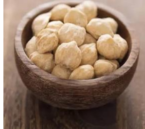
Gambar 9. Gambiri

Tanaman ini adalah jenis tanaman liar yang sering digunakan sebagai bahan rempah. Dengan sifatnya yang fleksibel, tanaman ini dapat tumbuh dengan mudah di berbagai lingkungan. Keberadaannya yang serbaguna dan kemampuannya untuk beradaptasi menjadikannya pilihan populer dalam masakan dan obat tradisional.