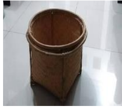
Gambar 1. Ampang

Bapak Maruli Pandiangan Simanjuntak, pada 19 Juli 2024, untuk mendapatkan wawasan mendalam mengenai simbol-simbol dalam upacara tersebut. Dokumentasi berupa foto-foto upacara juga diambil pada tanggal yang sama untuk melengkapi data simbol yang digunakan dalam Sijagaron. Penelitian ini menggabungkan observasi, wawancara, dan dokumentasi gambar untuk memahami makna simbolik dalam tradisi Saur Matua.