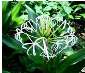
Gambar 6. Ompu ompu

Tanaman ini adalah ilalang yang fleksibel dan berwarna hijau. Dengan sifatnya yang lentur, ilalang ini mudah menyesuaikan diri dengan lingkungan sekitarnya. Warna hijaunya memberikan kesan alami dan segar, menjadikannya elemen yang menarik dalam berbagai komposisi taman atau lanskap.