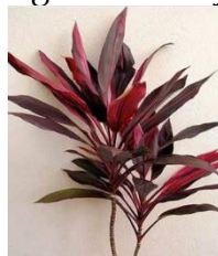
Gambar 4. Silinjuang

Tanaman ini memiliki daun berwarna hijau tua dengan ranting dan daun yang lebat. Keberadaan daun yang padat menciptakan tampilan yang rimbun dan memberikan kesan kesejukan. Tanaman ini tidak hanya menambah keindahan tetapi juga menciptakan suasana yang asri dan nyaman di sekitarnya.