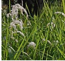
Gambar 5. Sanggar

Tanaman ini memiliki batang yang lurus dan tinggi, sementara daun-daunnya berwarna merah dengan sedikit nuansa kehijauan. Kontras antara batang yang tegak dan daun yang berwarna menciptakan tampilan visual yang menarik, memberikan sentuhan warna yang mencolok dan menambah keindahan keseluruhan tanaman.