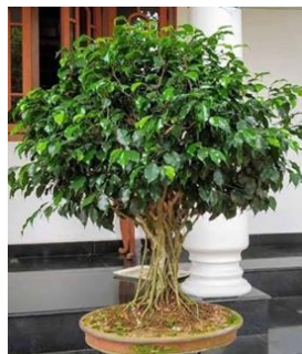
Gambar 7. Baringin

Tanaman ini memiliki daun yang panjang dan lebar, serta berwarna hijau. Daunnya yang besar dan lebar memberikan tampilan yang mencolok dan menyegarkan, menambah keindahan visual serta memberikan kesan rimbun dan subur pada tanaman tersebut.