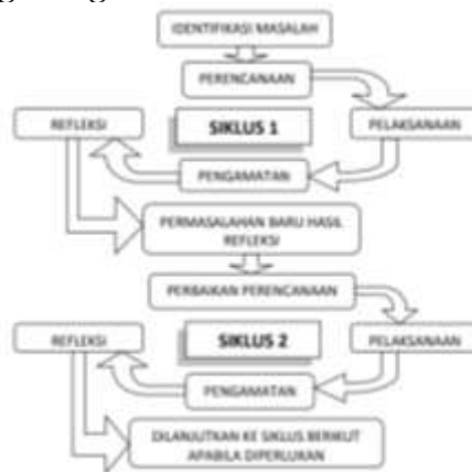
Gambar 1. Siklus Penelitian Tindakan Kelas

PTK dilakukan melalui beberapa tahapan siklus yang akan dihentikan jika sudah memenuhi indikator keberhasilan. Setiap siklus terdiri dari dua pertemuan. Adapun tahapan pada setiap siklus terdiri dari permasalahan, perencanaan, pelaksanaan, pengamatan, analisis data dan refleksi. Pada penelitian ini jika siklus I kemampuan pemecahan masalah matematis siswa belum mencapai indikator yang ditetapkan, maka dilaksanakan siklus II. Siklus akan berhenti jika kemampuan pemecahan masalah matematis siswa telah mencapai indikator yang diinginkan.