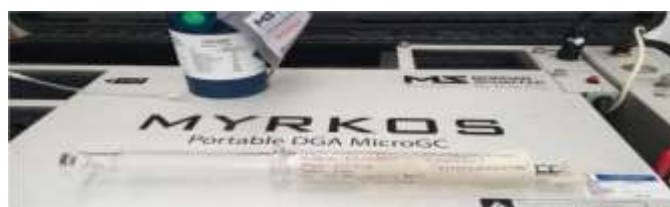
Gambar 2. Myrcos Portable DGA Micro GC-Morgan Schaffer Doble

Merek : CENTRADO 200 KVA Serial Number : RO2008060 TAHUN 2020 Metode uji : IEC 60567 Tahun 2011/ ASTM3612-C Standar Interpretasi : IEEE std.C.57-104.2008 Alat Uji : Myrcos Portable DGA Micro GC-Morgan Schaffer Doble seperti terlihat pada Gambar 2.