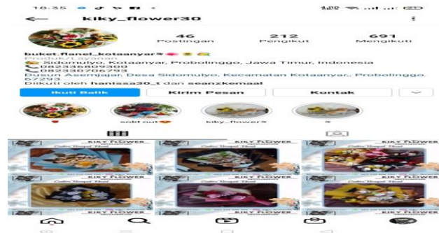
Gambar 3.1 media promosi Iin Flower

Beliau mengatakan bahwa mekanisme transaksi jual beli online di tokonya ialah customer harus membayar terlebih dahulu barang yang di pesan setelah itu, penjual memberitahukan kembali bahwa barang tersebut akan di kirim. Sebelum pesan barang tersebut customer juga sudah mengetahui bahwa barang tersebut Pre-Order maksimal 4 Hari Kerja. Kegiatan promosi atau menawarkan barang yang di lakukan Iin Flower juga di lakukan di beberapa media yang terdapat dalam gambar di bawah ini :