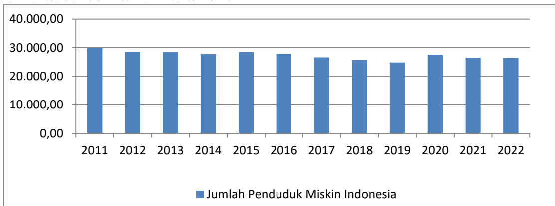
Gambar 1. Perkembangan Jumlah Penduduk Miskin di Indonesia Tahun amatan 2011-2022

Menurut Melbourne Institute (2012) garis kemiskinan dapat diartikan sebagai tingkat pendapatan atau pengeluaran yang ditetapkan, dimana bila pendapatan seseorang di bawah tingkat tersebut, maka ia digolongkan miskin. Kemiskinan menjadi permasalahan serius yang dihadapi setiap negara di dunia, termasuk Indonesia. jumlah penduduk miskin di Indonesia berfluktuasi dari tahun ke tahun.