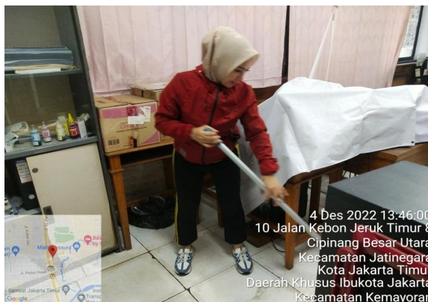
Gambar 4. Proses Pengerjaan Ruang Teknik Universitas Mpu Tantular

Berikut merupakan keadaan ruang Fikom Universitas Mpu Tantular yang mana telah tersusun rapi dengan menempatkan barang-barang yang ada didalam ruang tersebut sesuai dengan penerapan tataletak yang benar, dengan menerapkan barang-barang tersebut dengan benar dapat meningkatkan efektifitas komunikasi di dalam ruangan tersebut. Penelitian ini dilaksanakan juga di ruang Fakultas Teknik Universitas Mpu tantular juga. Yang mana penyusunan tata letak ruangan agar dapat mencapai komunikasi yang lancar dan dapat meningkatkan keefektifan kegiatan.