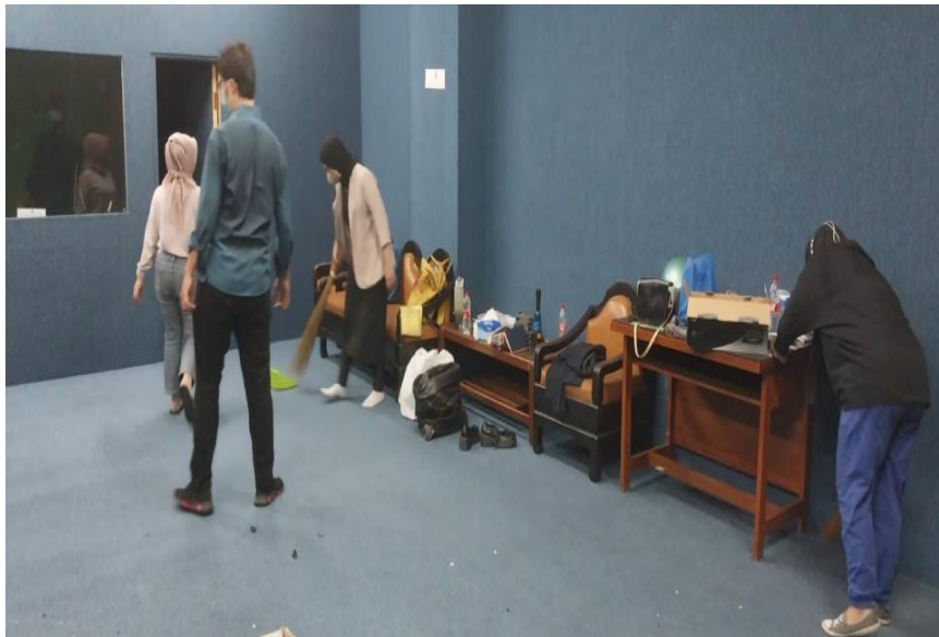
Gambar 2. Kondisi Sebelum Melakukan Renovasi di Ruang Fikom

Hasil penelitian diperoleh bahwa tata ruang dosen fakultas Teknik sudah tersusun secara tepat yang berarti bahwa dalam penyusunan tata ruang, penyusunan perabot, penyusunan alat-alat kantor serta lingkungan fisik yang ada sudah tersusun secara tepat sehingga mendukung dalam proses penyelesaian pekerjaan dosen secara efektif. Komunikasi intern di ruang dosen fakultas teknik sudah efektif. Hal ini menunjukkan bahwa komunikasi intern yang terjalin, baik komunikasi ke bawah, komunikasi ke atas dan komunikasi horisontal sudah efektif sehingga memudahkan dosen dalam melakukan koordinasi maupun dalam menyampaikan informasi sehubungan dengan adanya kebijakan maupun informasi penting lainnya dalam dunia pendidikan yang dapat meningkatkan efektivitas kerja dosen.