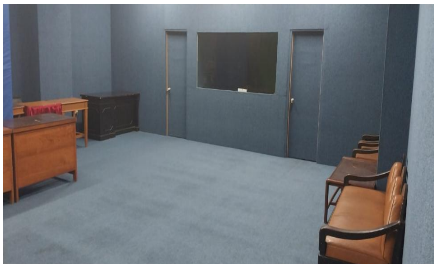
Gambar 3. Keadaan Ruang Fikom Universitas Mpu Tantular Setelah Tersusun Rapi

Berikut merupakan keadaan ruang Fikom Universitas Mpu Tantular yang mana telah tersusun rapi dengan menempatkan barang-barang yang ada didalam ruang tersebut sesuai dengan penerapan tataletak yang benar, dengan menerapkan barang-barang tersebut dengan benar dapat meningkatkan efektifitas komunikasi di dalam ruangan tersebut. Penelitian ini dilaksanakan juga di ruang Fakultas Teknik Universitas Mpu tantular juga. Yang mana penyusunan tata letak ruangan agar dapat mencapai komunikasi yang lancar dan dapat meningkatkan keefektifan kegiatan.