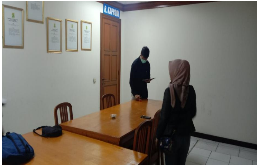
Gambar 5. Kondisi Ruang Teknik yang Setelah di Tata Rapi

tersebut. Karena barang-barang yang ada dalam ruangan tersebut belum tersusun secara sistematis dapat mengganggu kegiatan.