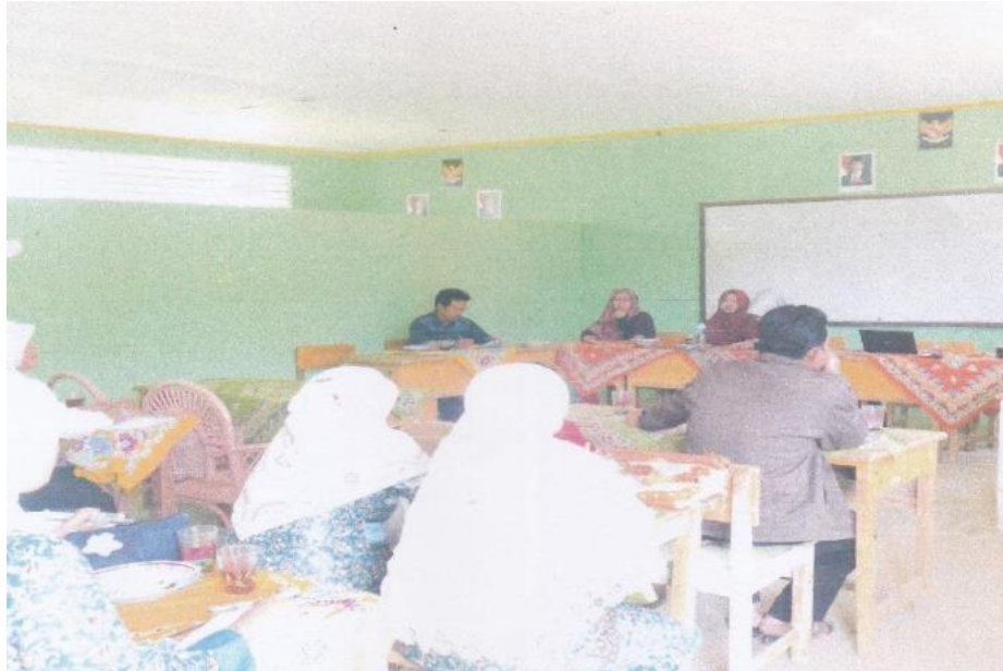
Gambar 4. Kegiatan Pelatihan PTK di Sekolah Mitra