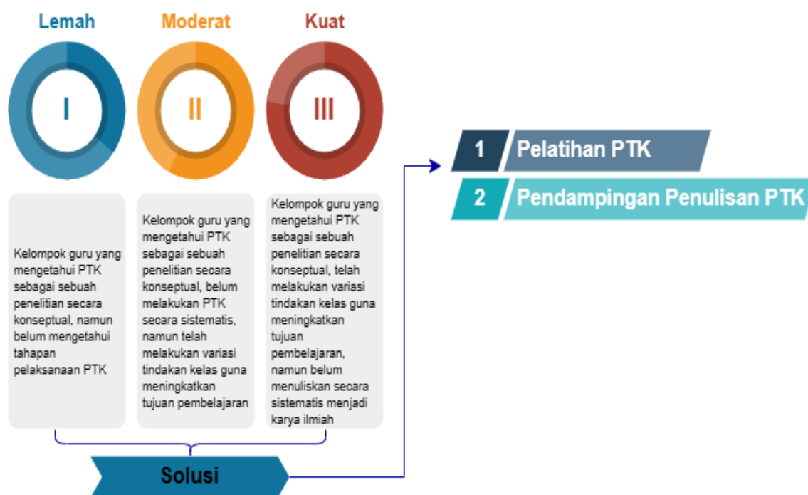
Gambar 3. Kondisi Empiris Mitra dan Solusi Tim Penulis

Terdapat tiga klasifikasi kemampuan guru dalam memahami dan menerapkan PTK di kelas. Klasifikasi I guru cenderung lemah, hanya memiliki pengetahuan konseptual, namun belum mengetahui tahapan pelaksanaan PTK. Klasifikasi II disebut moderat, karena para guru telah mengetahui dan menerapkan prinsip pelaksanaan PTK namun belum sistematis dan belum terdokumentasikan dalam laporan dan karya ilmiah. Klasifikasi III guru memiliki kapasitas kuat, dicirikan memiliki pengetahuan PTK secara konseptual dan teoritis, telah melakukan tahapan dan siklus PTK, namun belum menulis menjadi karya ilmiah, yang bisa dipublikasikan kepada khalayak. Klasifikasi Moderat cenderung dominan ditemukan di SD PT. BTN.