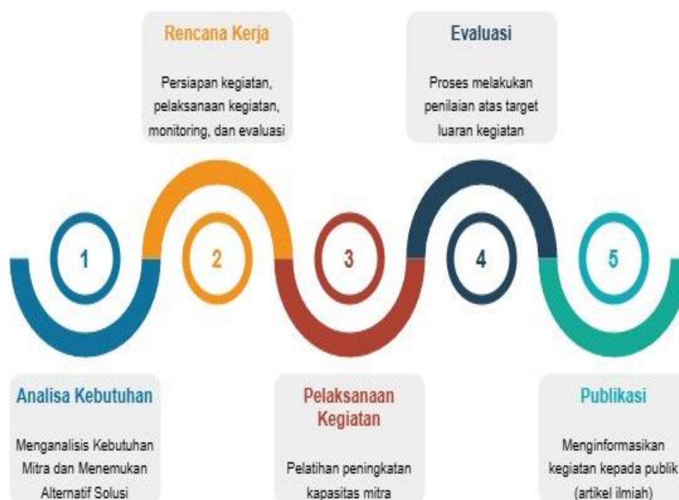
Gambar 2. Tahapan Pelaksanaan Peningkatan Kapasitas Guru Mengimplementasikan PTK

Tahap awal kegiatan pelatihan dan pendampingan PTK, tim melakukan identifikasi persoalan mitra, yang kemudian dipergunakan sebagai upaya mengidentifikasi kebutuhan guru. Berdasarkan temuan empiris menunjukkan guru membutuhkan upaya peningkatan partisipasi siswa dalam pembelajaran, peningkatan kemampuan siswa menguasai materi pembelajaran, agar tercapai tujuan pembelajaran, namun selama ini guru belum menerapkan PTK sebagai tools untuk mengurai persoalan di tingkat kelas. Setelah mengetahui bahwa PTK dapat menjadi alternatif solusi, dilakukan proses pengidentifikasian kemampuan guru melaksanakan PTK. Temuan menunjukkan bahwa seluruh guru di SD PT. BTN telah mengetahui gagasan tentang PTK sebagai sebuah penelitian dengan lokus kelas, mampu menemukan persoalan dalam proses pembelajaran, dan menemukan alternatif solusi dengan memberikan tindakan tertentu yang terencana, didokumentasikan, dan terukur (dilihat dari partisipasi peserta didik, dan tercapai tujuan pembelajaran). Kemudian terdapat variasi pengetahuan guru secara teoritis dan praktik dalam melaksanakan PTK, lihat gambar berikut: