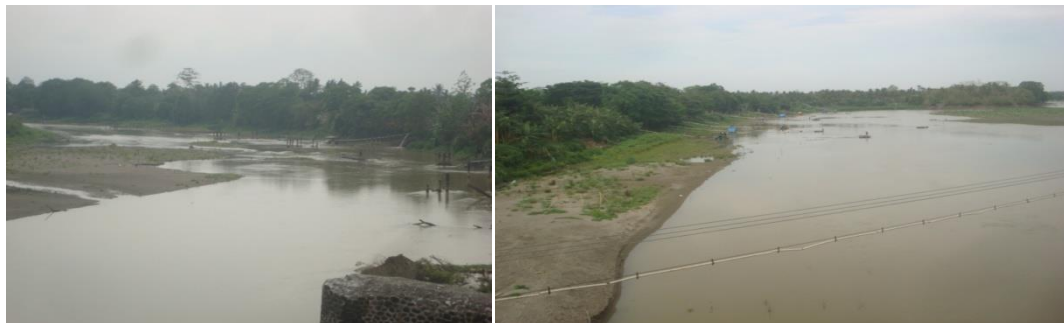
Gambar 4. Kondisi Penambangan Pasir Sungai Saddang