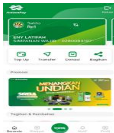
Gambar 2. ActionsPay Mobile KSPPS BMT BUS

KSPP BMT Bina Ummat Sejahtera mulai mengagas financial technology untuk dipergunakan dalam penggunaan fasilitas mulai digagas pada tahun 2019. Namun pada tahun itu baru tahap sosialisasi dan uji coba atas aplikasi dengan nama " BMT Mobile". Namun aplikasi tersebut mulai diperbaharui dengan penyesuaian kapasitas serta penggunaan yang memang dibutuhkan oleh koperasi syariah tersebut. Aplikasi pengganti BMT Mobile adalah ActionsPay Mobile. Dengan penambahan fitur yang tidak kalah menarik dengan Mobile banking. Berikut tampilan fitur ActionsPay Mobile: