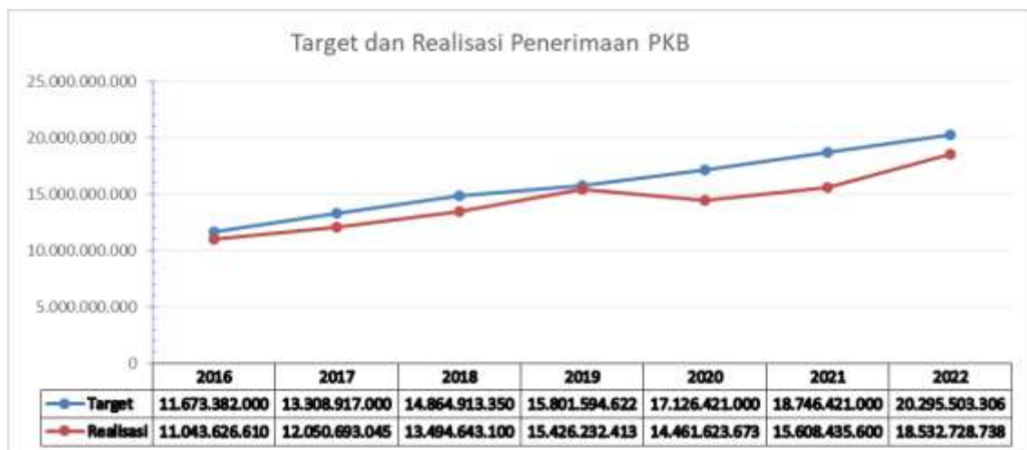
Gambar 3. Grafik Target dan Realisasi Penerimaan Pajak Kendaraan Bermotor di SAMSAT Tomohon

Berdasarkan gambar 4.3 hasil data yang telah didapatkan sebelumnya terlihat bahwa realisasi Penerimaan Pajak Kendaraan Bermotor melalui e-SAMSAT Tomohon mengalami kenaikan dan penurunan. Dalam kurun waktu 7 tahun yaitu tahun 2016 hingga tahun 2022, penerimaan pajak kendaraan bermotor pada tahun 2020 mengalami penurunan. Selain itu, penerimaan pajak kendaraan bermotor pada tahun 2016 hingga tahun 2022 belum mampu mencapai target penerimaan pajak kendaraan bermotor.