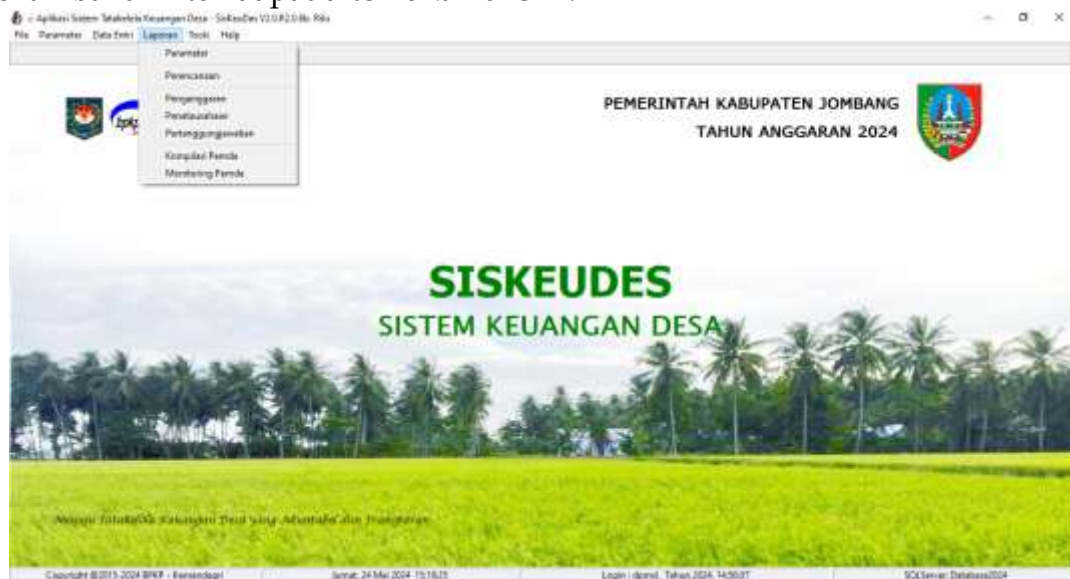
Gambar 1. Tampilan Penggunaan Siskeudes versi 2.0.6b (Menu Monitoring Pemda)

Untuk Aplikasi Siskeudes versi 2.0.6b, beberapa tampilan menu dan penambahan fitur dapat ditemukan di sini: