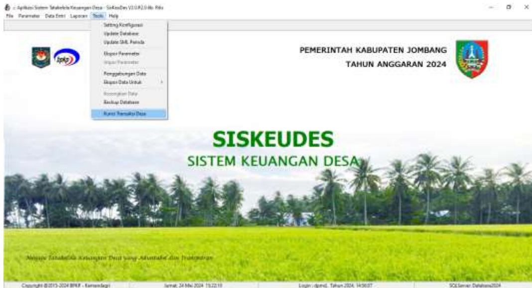
Gambar 2. Tampilan Aplikasi Siskeudes versi 2.0.6b (Menu Kunci Transaksi Desa)