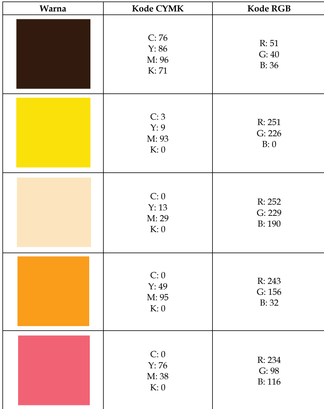
Table 1: table warna kode CYMK dan kode RGB

Berikut ini adalah beberapa kode warna CYMK dan kode warna RGB yang dipakai untuk desain logo Keripik Pisang Mak Iyak.