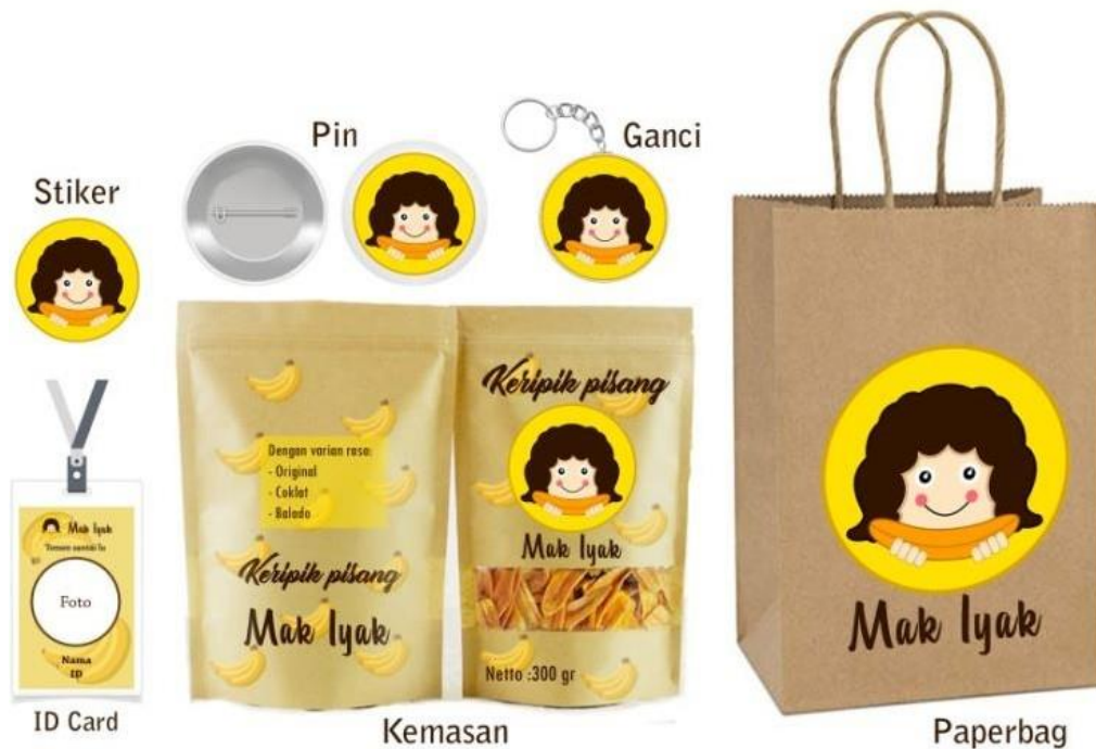
Gambar 5. Media promosi merchandise

Media promosi yang digunakan untuk pemasaran produk Keripik Pisang Mak Iyak adalah sticker , paperbag , kemasan, pin, ID Card dan gantungan kunci dan poster.