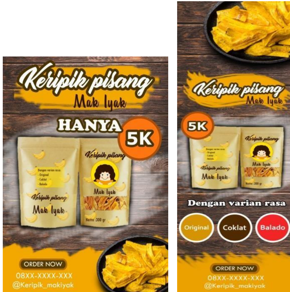
Gambar 6. Media Promosi Poster dan Banner