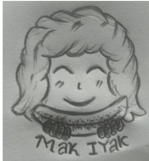
Gambar 2. sketsa logo terpilih