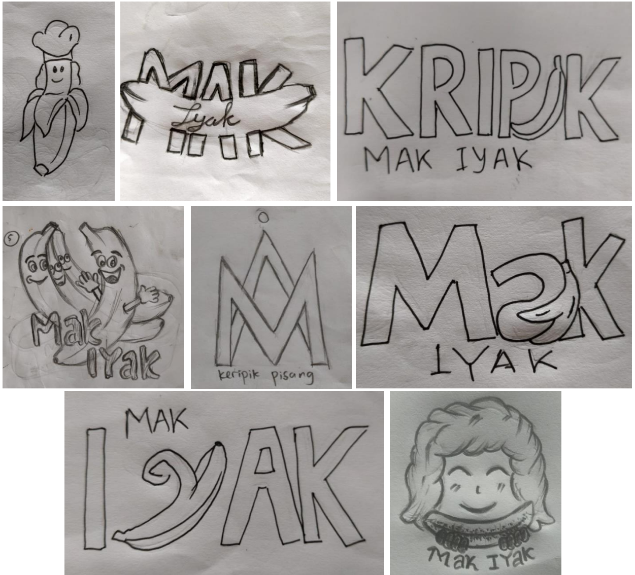
Gambar 1. Sketsa Alternatif

Untuk mendapatkan desain logo yang baik dan tepat sasaran, diperlukan beberapa alternatif desain sketsa yaitu sebagai berikut: