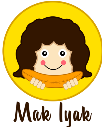
Gambar 4. Logo Mak iyak