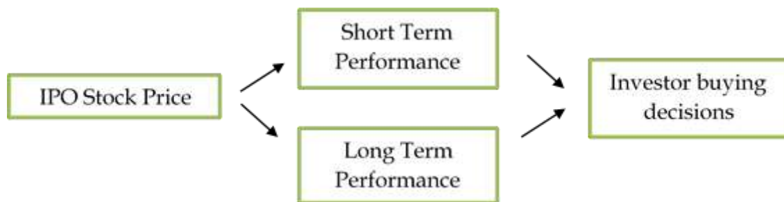
Figure 3. Conceptual Framework

Dengan menggabungkan ketiga framework ini, kita dapat menyimpulkan bahwa kinerja saham IPO dipengaruhi oleh interaksi antara faktor-faktor jangka pendek dan jangka panjang, yang berkontribusi terhadap keputusan investor. Di awal perdagangan, fenomena underpricing memainkan peran utama dalam menarik minat investor untuk membeli saham IPO. Sementara itu, dalam jangka panjang, stabilitas kinerja perusahaan, yang didorong oleh faktor fundamental, menjadi penentu utama bagi keberlanjutan minat investor. Oleh karena itu, baik investor jangka pendek maupun jangka panjang harus mempertimbangkan kombinasi antara sinyal pasar yang diterima selama IPO dan kinerja perusahaan yang lebih mendalam untuk mengambil keputusan investasi yang lebih bijak.