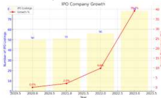
Gambar 1. Pertumbuhan Perusahaan IPO

Pasar keuangan memiliki peran yang sangat penting dalam membentuk stabilitas ekonomi dan mendorong pertumbuhan korporasi, terutama dalam perekonomian global yang semakin terintegrasi. Salah satu mekanisme penting dalam pengembangan pasar modal dan strategi pendanaan perusahaan adalah melalui investasi melalui Penawaran Umum Perdana Saham (Initial Public Offering/IPO) (Thani et al., 2024).