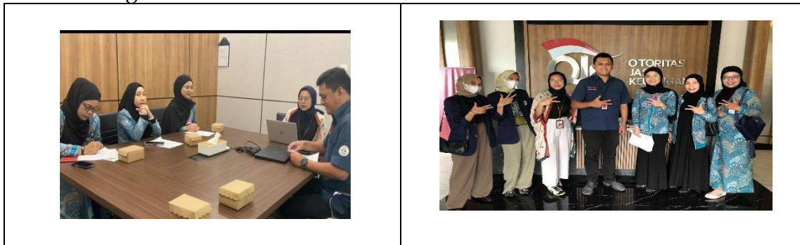
Gambar 3. Dokumentasi dan wawancara dengan Staf OJK