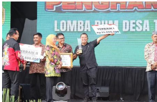
Gambar.10 Ketua BUMDes Ngudi Sejahtera Ngunut pada Saat Menerima Penghargaan

Upaya revitalisasi yang dilakukan oleh Pemerintah Desa Ngunut maupun pengurus BUMDes hingga saat ini sudah ke arah yang jauh lebih baik. Dengan adanya BUMDes, kesejahteraan Masyarakat serta kebutuhan Masyarakat Ngunut dapat terbantu dengan baik. Akses layanan informasi juga sangat mudah didapat dengan aktifnya media sosial BUMDes di platform Instagram dengan nama akun @bumdesangudisejahtera. Dengan hal ini, Masyarakat dapat mendapatkan informasi seputar layanan terbaru dan ter-update dari BUMDes. Keseriusan dan juga keaktifan pengurus membuahkan hasil positif terbukti dengan diraihnya Juara 1 Terbaik kategori Bermanfaat di ajang Lomba BUMDesa Tingkat Provinsi Jawa Timur pada tahun 2023.