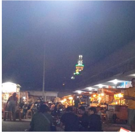
Gambar. 9 Warung Desa

Upaya revitalisasi yang dilakukan oleh Pemerintah Desa Ngunut maupun pengurus BUMDes hingga saat ini sudah ke arah yang jauh lebih baik. Dengan adanya BUMDes, kesejahteraan Masyarakat serta kebutuhan Masyarakat Ngunut dapat terbantu dengan baik. Akses layanan informasi juga sangat mudah didapat dengan aktifnya media sosial BUMDes di platform Instagram dengan nama akun @bumdesangudisejahtera. Dengan hal ini, Masyarakat dapat mendapatkan informasi seputar layanan terbaru dan ter-update dari BUMDes. Keseriusan dan juga keaktifan pengurus membuahkan hasil positif terbukti dengan diraihnya Juara 1 Terbaik kategori Bermanfaat di ajang Lomba BUMDesa Tingkat Provinsi Jawa Timur pada tahun 2023.