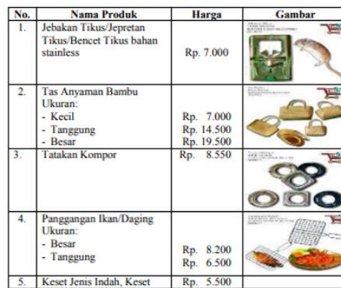
Gambar.8 Unit Usaha BUMDes