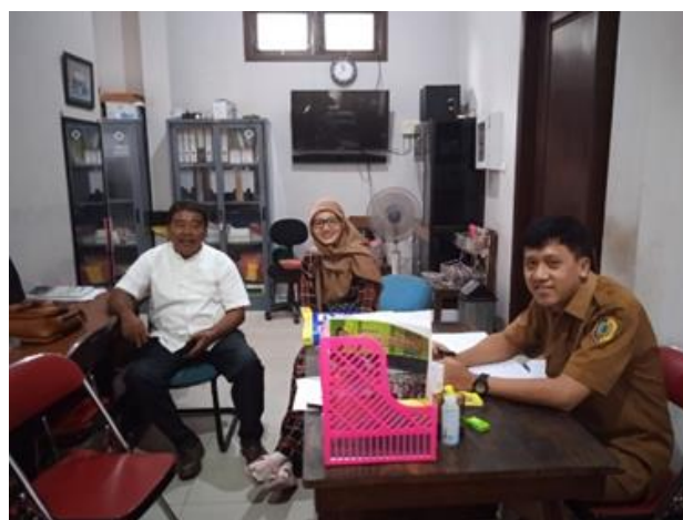
Gambar.3 Kegiatan Wawancara Bersama Kepala Desa Ngunut