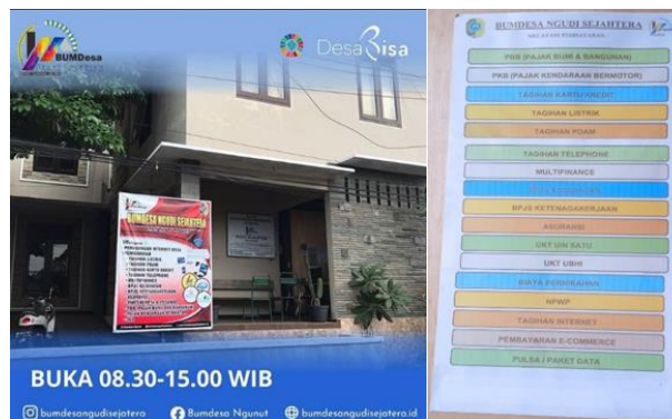
Gambar.7 Unit Usaha PPOB BUMDes