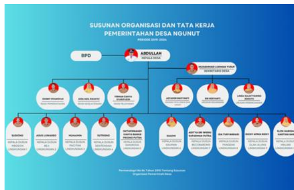
Gambar.2 Struktur Organisasi dan Tata Kerja

Adapun struktur organisasi pemerintahan Desa Ngunut, Kecamatan Ngunut, Kabupaten Tulungagung, yaitu: