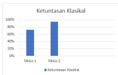
Gambar 2. Grafik

Hal ini dapat dilihat pada grafik berikut :