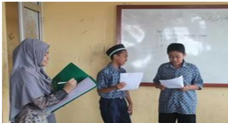
Gambar 2 Siswa kelas VII MTs Ummi Kulsum Kota Sukabumi presentasi hasil diskusi