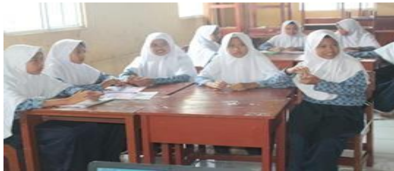
Gambar 1 Siswa kelas VII MTs Ummi Kulsum Kota Sukabumi melakukan diskusi

siklus I yaitu sebesar 77,53 setelah dikategorikan diketahui bahwa hasil partisipasi siswa pada siklus I berada pada kategori sangat tinggi. Sedangkan hasil partisipasi siswa pada siklus II adalah dari 23 subjek yang diteliti hanya 1 siswa (3,33%) yang hasil partisipasinya sedang, 5 siswa (23,33%) yang hasil partisipasinya tinggi, dan 17 siswa (73,33%) yang hasil partisipasinya sangat tinggi. Sehingga skor rata-rata hasil partisipasi siswa siklus II yaitu sebesar 87,27.