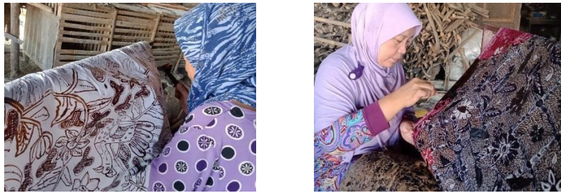
Gambar 2. Beberapa Pengrajin Batik Anggota UMKM Batik Sentra Desa Dagan

Dapat dilihat pada gambar di atas, para pengrajin batik tampak mengaplikasikan teknik-teknik membatik dengan baik. Observasi peneliti menunjukkan bahwa para pembatik mempraktikkan teknik membatik seperti apa yang telah diajarkan pada pelatihan dan yang selalu diingatkan pada acara pertemuan rutin sebagai upaya yang dilakukan UMKM Batik Sentra Desa Dagan dalam meningkatkan perkembangan sumber daya manusia.