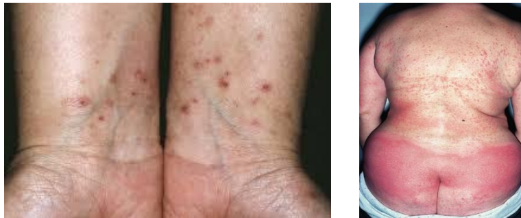
Gambar 2. Gambaran Klinis SCD

Ada beberapa kategori DKS, yang berasal dari original sindrom Baboon, yang diciptakan oleh Andersen dan rekannya. Berikut ini adalah subkategori utama DKS yang ada: BS, Systemic drug-related intertriginous and flexural exanthema (SDRIFE), Allergic contact dermatitis syndrome (ACDS), dan Systemic nickel allergy syndrome (SNAS). Banyak dari istilah-istilah ini digunakan secara bergantian dan tidak didefinisikan dengan baik atau distandarisasi menurut pedoman apa pun (2).