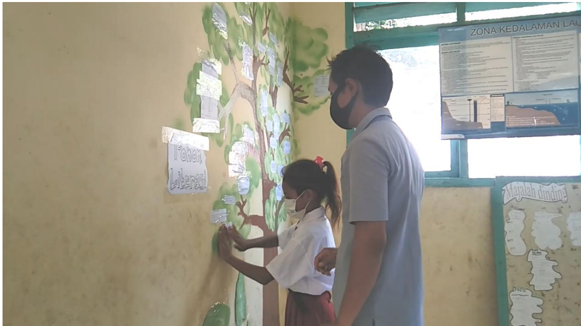
Gambar 9. Peserta Didik Menempelkan Pokok Pikiran Hasil Literasi pada Pohon Baca