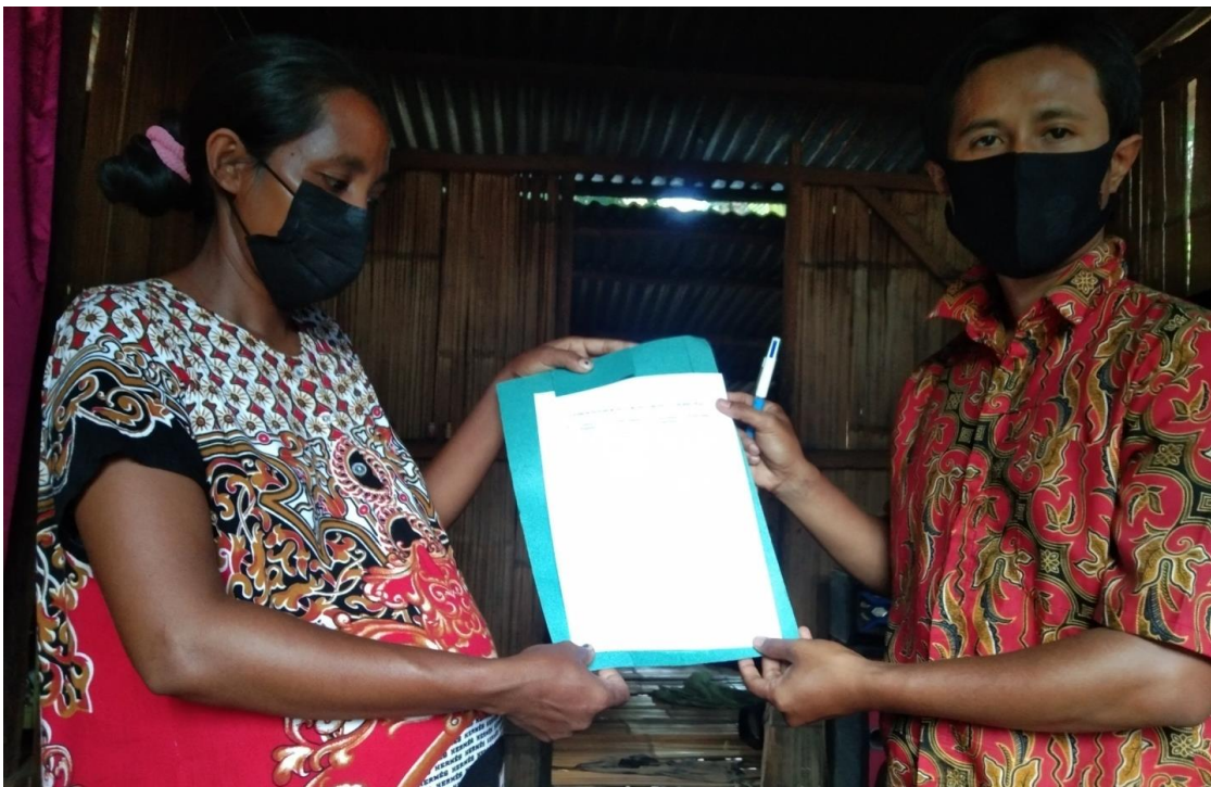
Gambar 12. Persetujuan Orangtua Siswa untuk Tambahan Jam Pelajaran