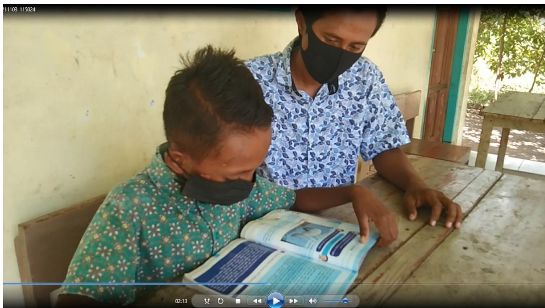
Gambar 13. Bimbingan Literasi bagi Siswa yang belum Mampu Membaca dengan Cepat