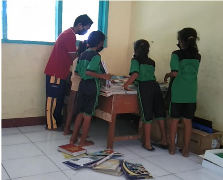
Gambar 3. Bekerjasama Membuat Pojok Literasi