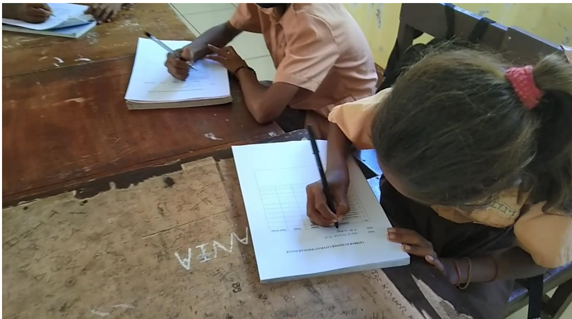
Gambar 15. Pengisian Kuisoner Evaluasi Kegiatan Literasi