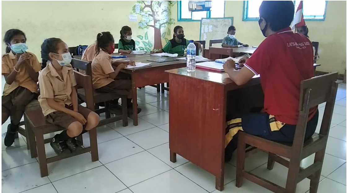
Gambar 14. Sosialisasi Evaluasi Kegiatan Literasi melalui Pengisian Kuisoner