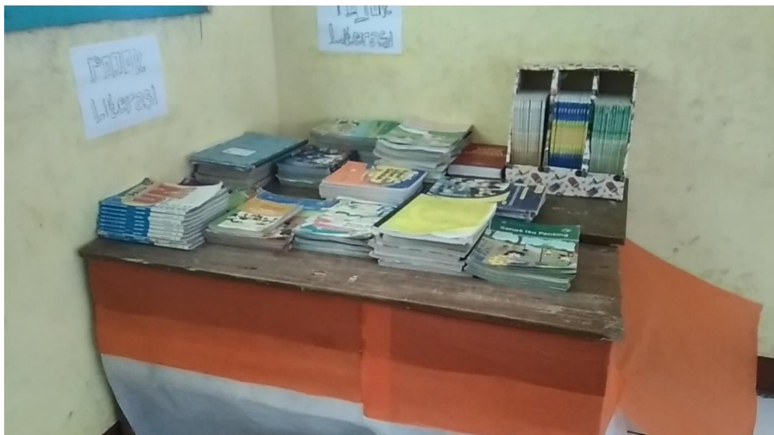
Gambar 4. Pojok Literasi Kelas V