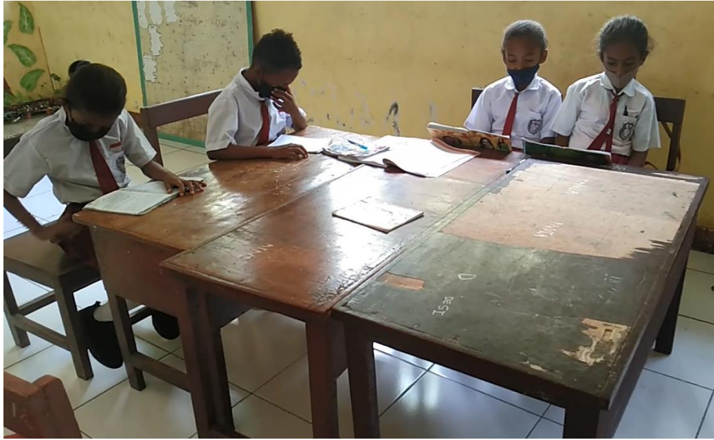
Gambar 7. Kegiatan Literasi 15 Menit