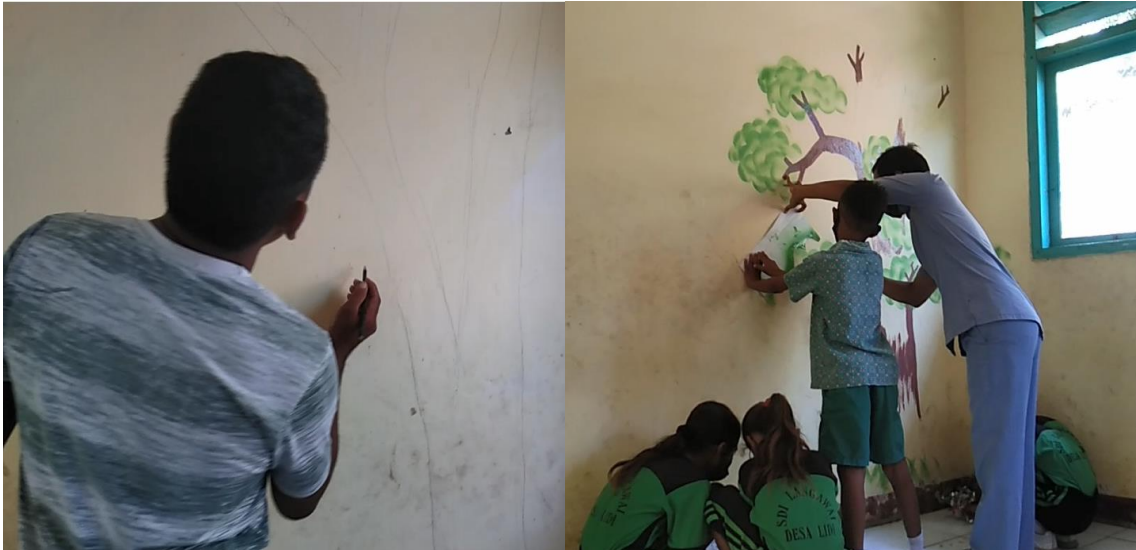
Gambar 5. Kolaborasi Rekan Guru dan Peserta Didik dalam Membuat Pohon Baca