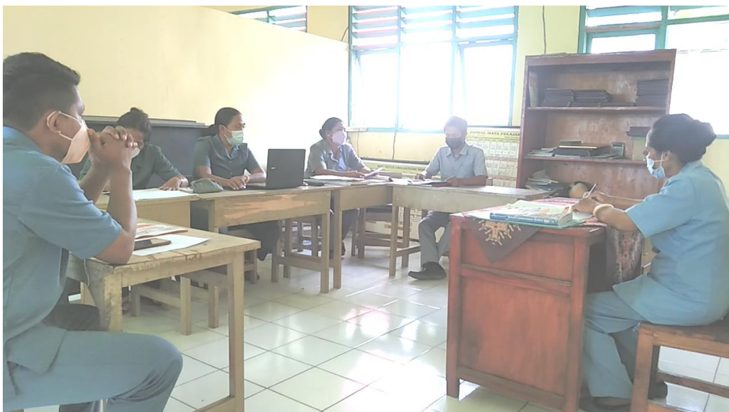
Gambar 1. Pertemuan atau Rapat Singkat Tentang Rancangan Kegiatan Aktualisasi