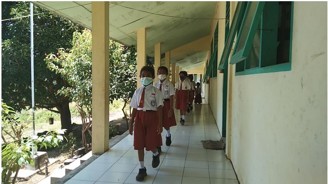
Gambar 10. Kunjungan ke Perpustakaan Sekolah