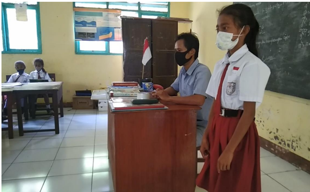
Gambar 8. Peserta Didik Menceritakan Kembali Materi yang telah Dibaca