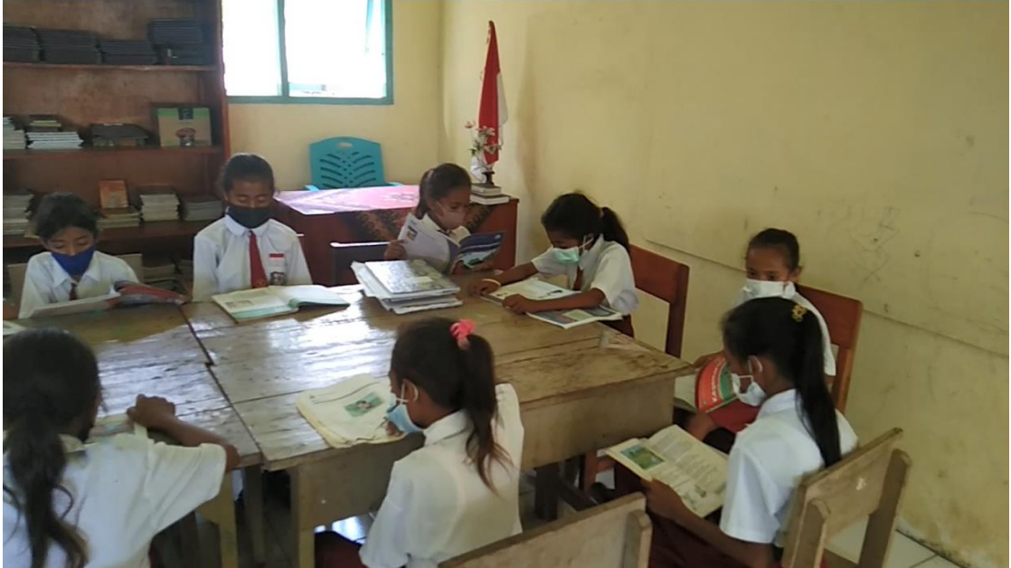
Gambar 11. Kegiatan Literasi di Perpustakaan Sekolah