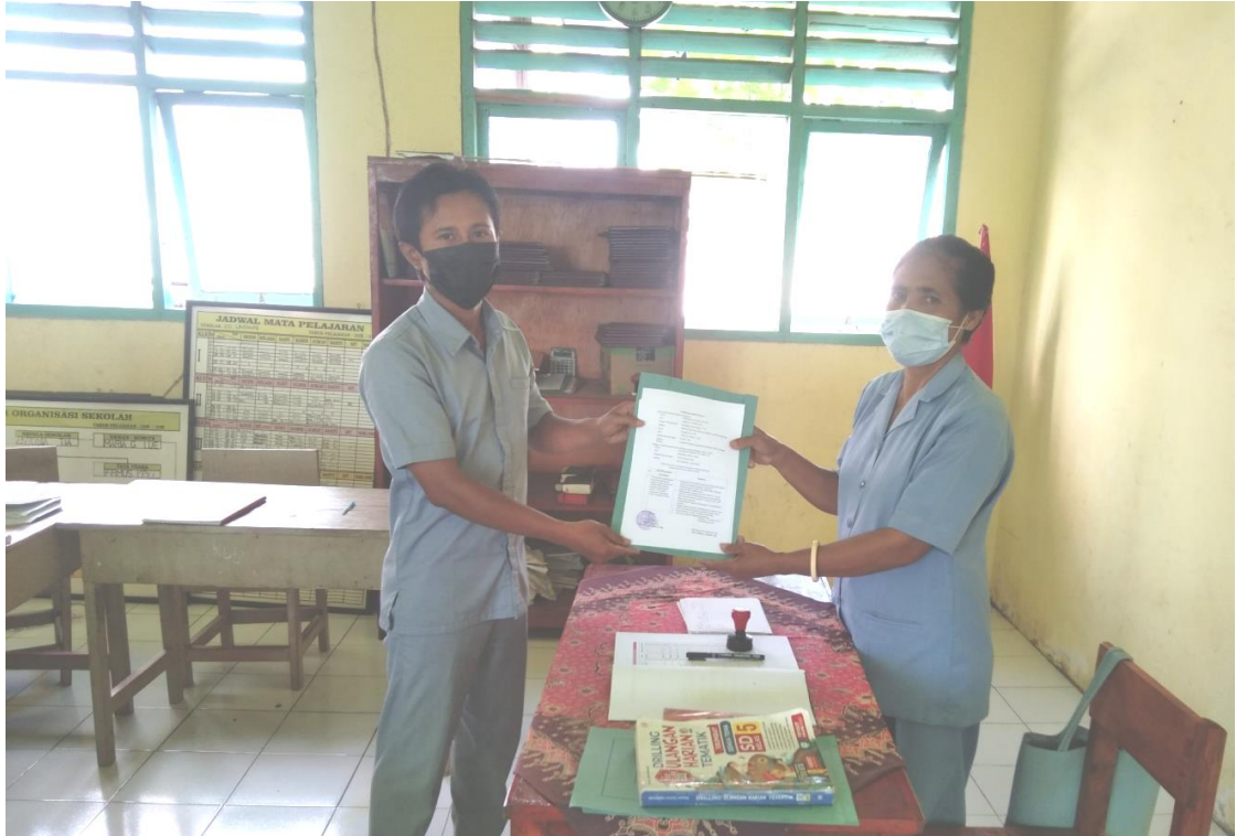
Gambar 2. Persetujuan Tentang Rancangan Kegiatan Aktualisasi