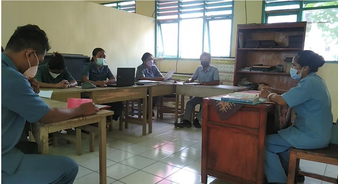
Gambar 16. Konsultasi dengan Mentor dan Berkolaborasi dengan Rekan Guru