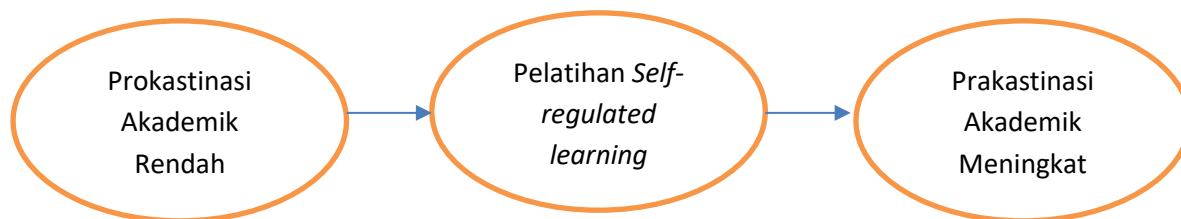
Gambar 1. Kerangka Berpikir