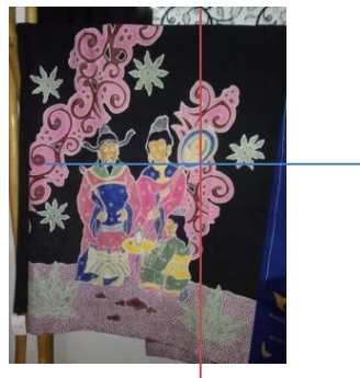
Gambar 3. (Balance/Keseimbangan)