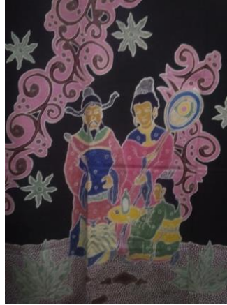
Gambar 1. Batik Tulis Motif Chongyang

Dari hasil penelitian yang dilakukan oleh penulis, berikut analisis gambar pertama dari segi estetika. Yang meliputi Unity (kesatuan), balance (keseimbangan), dominance (penonjolan).