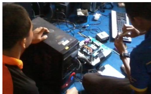
Gambar 3. Siswa SMK Merakit Komputer

Pada gambar 2, nampak awal pembelajaran diperlukan perencanaan yang meliputi pembuatan anggaran, tujuan pembelajaran, dan pembentukan tim pembelajaran( kelompok belajar). Pembuatan jadwal kegiatan meliputi tahapan kegiatan,urutan kegiatan dan lokasi. Pengawasan dilakukan oleh guru dan pengawas internal seperti anggota/ pengurus sekolah. Uji coba produk dilakukan dengan dua tahap, uji coba terbatas dan uji coba luas.