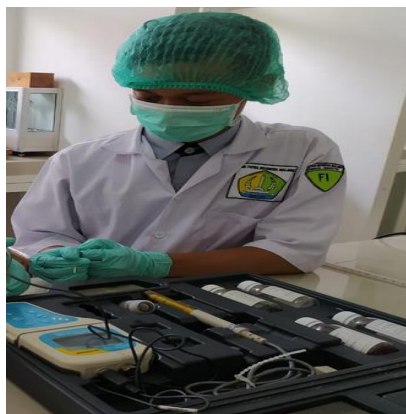
Gambar 1. Siswa SMK

“Sekolah kami sudah mencapai target pembelajaran berbasis proyek selama 3 tahun ini, sehubungan dengan program studi kami adalah sekolah farmasi, pada tahun 2021, siswa sudah mampu membuat cairan pembersih ruangan sendiri dan bahan cuci tangan untuk menghindari virus covid-19 beberapa tahun lalu...”