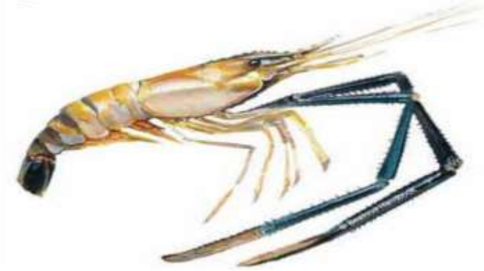
Gambar 1. Morfologi Udang Galah ( Macrobrachium Rosenbergii De Man)

Berikut adalah morfologi udang galah yang disajikan pada Gambar 1.