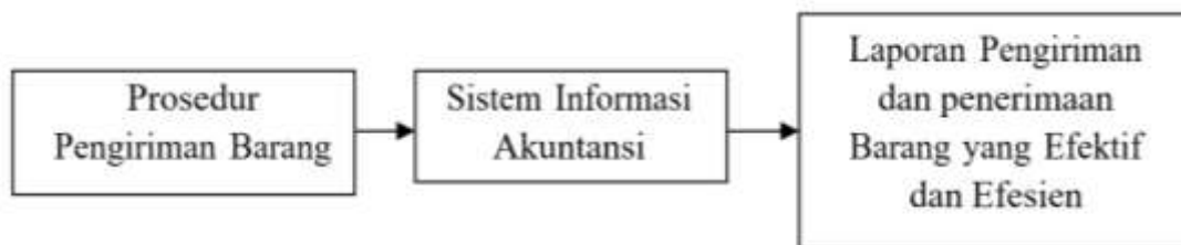
Gambar 1. Kerangka Berfikir

Salah satu sistem yang memegang peranan sangat penting dalam bisnis adalah sistem informasi akuntansi. Penerapan sistem informasi akuntansi yang sesuai dengan setiap situasi dan keadaan yang dihadapi suatu perusahaan akan sangat berkontribusi terhadap kelancaran arus transaksi yang dilakukan oleh perusahaan, serta akan memberikan data dan informasi yang dibutuhkan manajemen untuk mengambil keputusan dan memantau operasional. Berikan informasi untuk membuat perusahaan Anda lebih efisien. Salah satu sistem informasi akuntansi yang sangat penting bagi suatu perusahaan ekspedisi adalah sistem informasi akuntansi pengiriman barang.