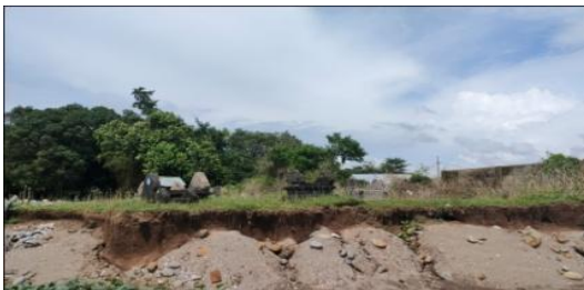
Gambar 4. Kondisi lahan masyarakat

Bencana alam abrasi pantai di daerah penelitian tidak hanya merusak permukiman masyarakat tetapi juga merusak lahan masyarakat seperti contohnya pemakaman umum yang rusak, menurut informan (AH) yang merupakan tokoh masyarakat