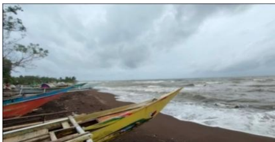
Gambar 2. Kondisi Pantai

Kondisi pantai disepanjang pesisir Desa Tamasaju tidak terdapat adanya tanggul maupun pemecah ombak yang berfungsi untuk meminimalisir dampak abrasi. Berdasarkan hasil wawancara terhadap informan (AH) sebagai tokoh masyarakat menjelaskan bahwa, keadaan ini diperparah dengan adanya