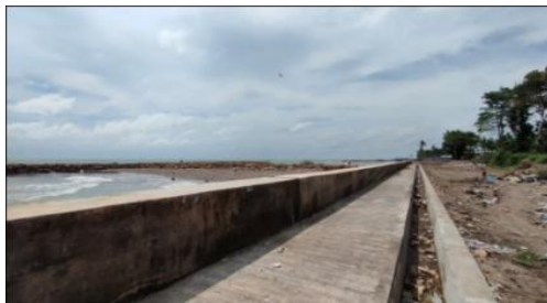
Gambar 6. Kondisi Tanggul

Pembangunan tanggul di Kecamatan Galesong Utara belum direalisasikan secara komprehensif oleh pemerintah, di antaranya Desa Tamasaju yang sama sekali belum dilakukan pembangunan tanggul guna meminimalisir dampak bencana. Adapun Desa Sampulungan telah dilakukan pembangunan tanggul sepanjang daerah pesisir yang jangka waktu pembangunannya memerlukan waktu sekitar 2-3 tahun.