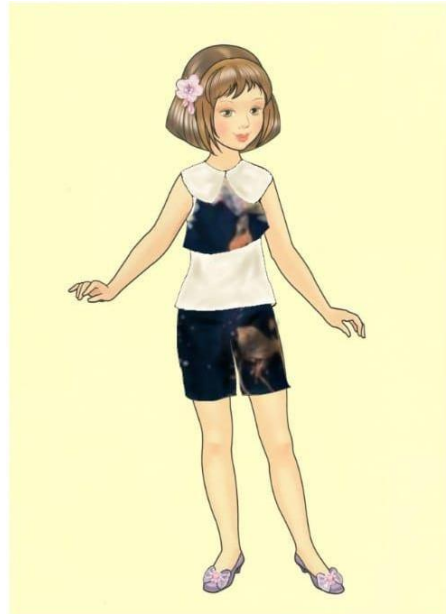
Gambar 1. Desain Busana Anak Kasual