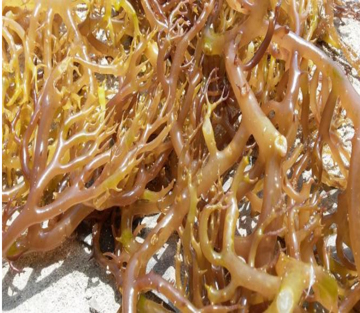
Gambar 3.6 Rumput Laut Coklat