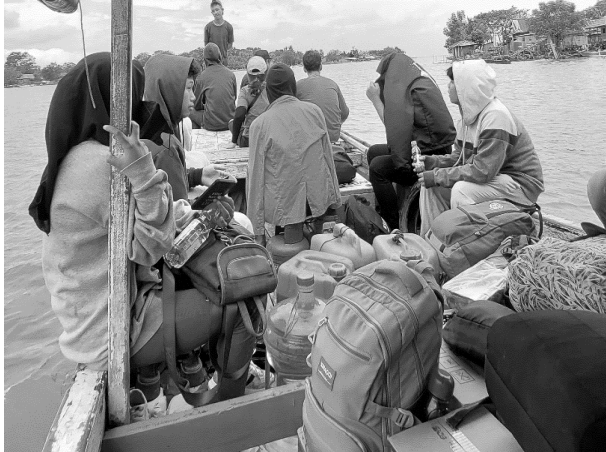
Gambar 1.3 Perahu yang digunakan untuk mengangkut barang dan penumpang

panjang serta memiliki ukuran yang cukup besar sehingga sering digunakan sebagai alat transportasi masyarakat maupun pengunjung untuk menyebrang antar pulau, antar desa, dan antar dusun.