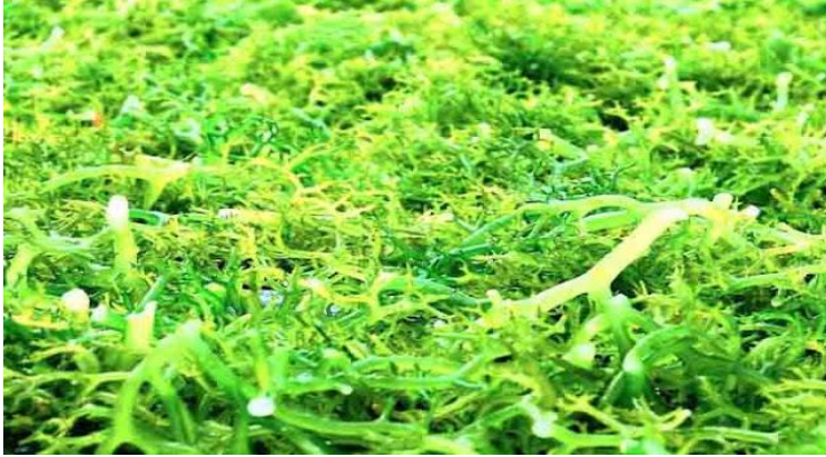
Gambar 3. 5 Rumpul Laut Hijau

Acetabularia, Caulerpa, Clodopora, Codium, Enteromorpha, Ulva dan Halimeda(Sarita et al., 2021).