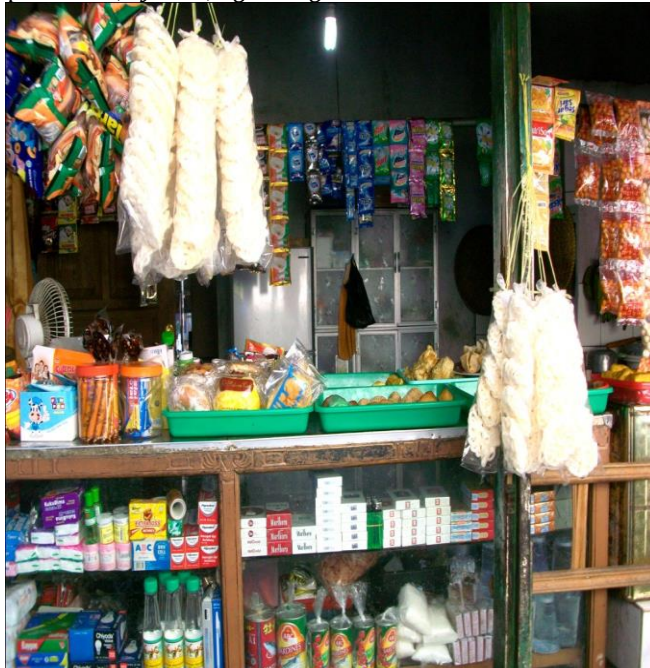
Gambar 3.12 Warung sebagai sumber pendapatan masyarakat

Sebagai daerah pulau, dalam dunia pekerjaan masyarakat sangat susah mencari kerja karena tempat yang jauh dari keramaian atau pusat kota. Sebagai manusia yang butuh akan penghasilan, tentu mencari pekerjaan itu sangat penting sehingga karena itulah masyarakat dusun bangko tinggia tidak bergantung pada hasil laut dalam hal ini rumput laut saja mereka juga tidak bisa jika hanya laki laki yang bekerja. Karena itulah perempuan atau ibu rumah tangga ikut serta dalam mencari pekerjaan dengan cara membuat usaha kecil kecilan seperti membuka war