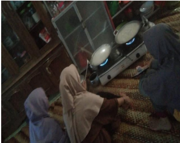
Gambar 3. 11 Salah satu kegiatan perempuan (ibu rumah tangga) yaitu menyiapkan makanan