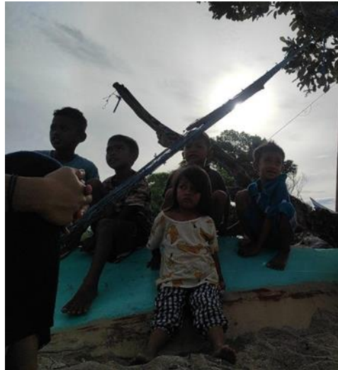
Gambar 4.2 Potret anak anak yang tidak bersekolah di hari sekolah.

Dalam Undang-Undang yang tercantum diatas merupakan pedoman agar pemerintah daerah memberikan pendidikan yang layak bagi masyarakat daerah terutamanya masyarakat yang berada di pesisir atau kepulauan seperti di Desa Maccinibaji