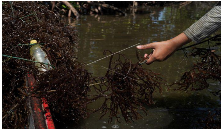
Gambar 3.8 Kerusakan Hasil Panen Rumput Laut

membudidayakan rumput laut karena tali sendiri adalah alat atau bahan utama yang di gunakan dalam pembudidayaan rumput laut. Masyarakat bangko tinggia terkadang merasa was wasan karena tidak adanya atau kurangnya tali yang di dapat, ini disebabkan karena banyaknya komsumen tali yang tidak sesuai dengan peredaran tali di pasar. Dalam ilmu ekonomi dinamakan kurangnya produksi dan banyaknya komsumen.