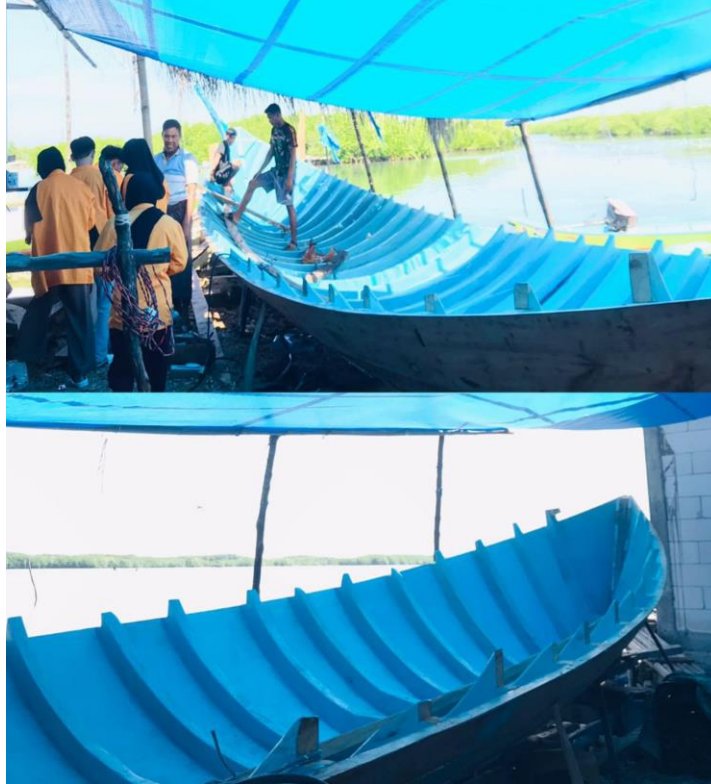
Gambar 3. 9 Proses Pembuatan Kapal

Equilibrium, Syukur, Agustang pembuat kapal apabila kayu di daerah bangko tinggia habis atau berkurang(kayu berkualitas baik).