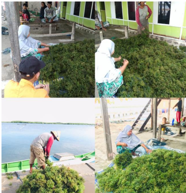
Gambar 3.1 Aktivitas Masyarakat

Indonesia, istilah rumput laut di pakai untuk menyebut baik Gulma laut dan Lamun. Gulma laut merupakan anggota dari kelompok vegetasi yang dikenal sebagai Alga (ganggang). Sumber daya ini biasanya dapat di temui di perairan yang berasosiasi dengan keberadaan ekosistem terumbu karang. Gulma laut biasanya dapat hidup di atas substrat pasir dan karang mati. (Rahardjanto, 2018).