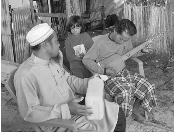
Gambar 1.1 Memainkan alat music gamboso

Gamboso ini biasanya dimainkan oleh masyarakat yang bekerja sebagai nelayan di atas kapal sebagai hiburan bagi mereka saat sedang berlayar. Mengingat perjalanan yang tidak menentu, karena pada saat itu, kapal belum memiliki mesin dan dalam perjalanannya masih mengandalkan tenaga dari hembusan angin. Adapun kapal yang digunakan pada saat itu masih memiliki layar yang berfungsi untuk menangkap angin serta menjadi alat kemudi, serta sayap yang terdapat di sisi kanan dan kiri kapal sebagai pelampung untuk menjaga keseimbangan kapal agar tidak mudah terbalik akibat diombang-ambing oleh ombak laut yang kencang. Akan tetapi seiring berjalannya waktu kapal yang digunakan saat ini sudah tidak lagi menggunakan sayap dan layar, tetapi sudah mengandalkan mesin untuk berlayar. Sehingga perjalanan saat berlayar terasa lebih cepat dan efisien serta tidak lagi bergantung pada kekuatan hembusan angin.