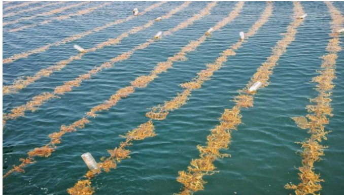
Gambar 3.7 Kondisi Laut yang menghadirkan rumput laut dengan nilai tinggi