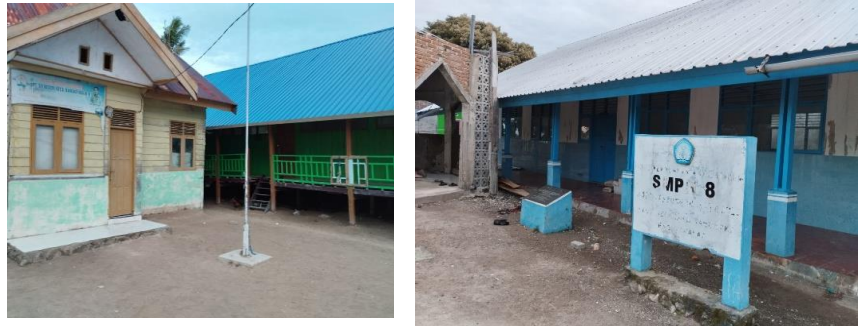
Gambar 4.1 Lokasi sekolah SD dan SMP

Selain itu, beberapa organisasi non-profit juga berusaha untuk membantu meningkatkan akses pendidikan di daerah-daerah terpencil dan miskin di Indonesia. Misalnya, Taman Bacaan Pelangi memiliki program perpustakaan keliling yang bertujuan untuk membawa buku-buku ke daerah-daerah terpencil di Indonesia dan memfasilitasi kegiatan membaca bagi anak-anak. Upaya lainnya adalah dengan membangun infrastruktur pendidikan yang lebih baik dan meningkatkan kualitas guru di daerah-daerah tersebut. Program pelatihan guru dan peningkatan fasilitas pendidikan merupakan langkah penting untuk meningkatkan akses pendidikan di daerah-daerah terpencil. Semua hal diatas hanya menjadi harapan bagi sekolah di desa Macini Baji dusun Bangko tinggia kecamatan Kepulauan Tanakeke Kabupaten Takalar, pasalnya dari hasil pengamatan yang kami temukan terdapat dua sekolah yakni sekolah dasar dan sekolah menengah pertama namun minim dalam penggunaannya, menurut keterangan warga bahwa tenaga pendidik dan tenaga pengajar hanya datang maximal 3 kali dalam sebulan yang berasal dari Takalar kota, dimana