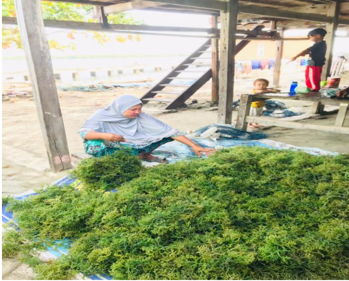
Gambar 3. 10 Aktivitas sehari hari (perempuan) ibu rumah tangga yaitu memisahkan dan memasang rumput laut