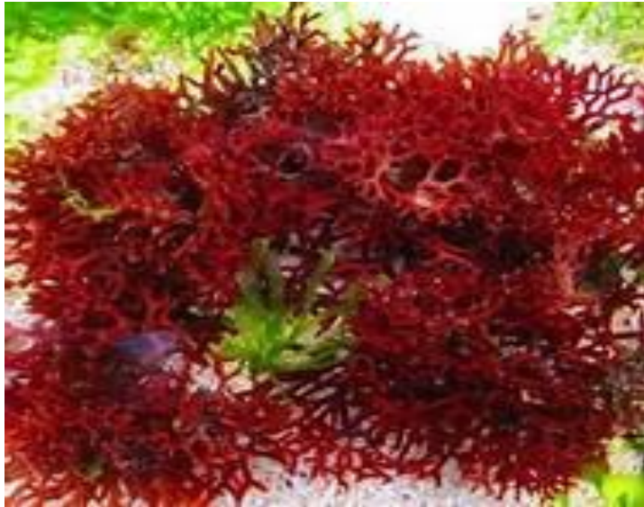
Gambar 3.4 Rumput Laut Merah

Rumput laut ini dihasilkan oleh pigmen merah yaitu fikokeritrin. Di Indonesia alga merah atau rumput laut merah terdiri dari 17 marga dan 34 jenis serta 31 jenis diantaranya sudah banyak dimanfaatkan dan bernilai ekonomis (Franki Yusuf Bisilisin, 2021).