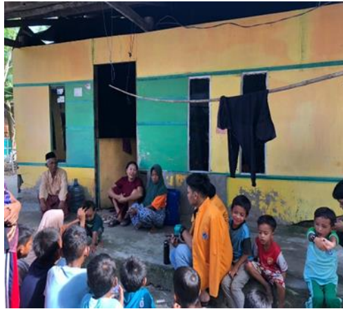
Gambar 4.3 Wawancara dengan masyarakat

Harapan masyarakat yang berada di Dusun Bangko Tinggia, agar kiranya pemerintah lebih memerhatikan system Pendidikan yang berada di dusun mereka, karna seperti yang kita ketahui bahwa Pendidikan adalah tiang utama untuk menciptakan SDM yang unggul dalam memajukan serta meningkatkan kesejahteraan desa.