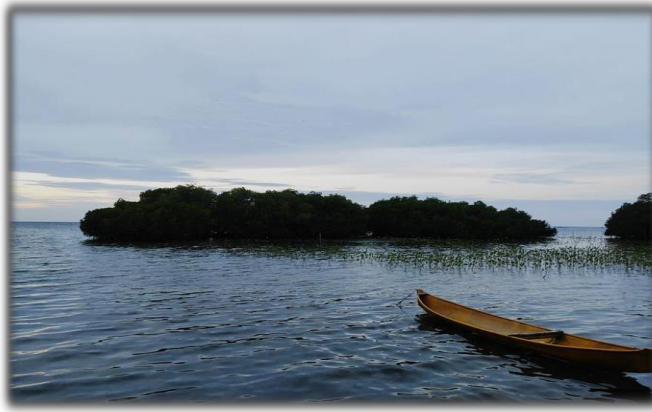
Gambar 2.1 Suasana lautan Bangko Tinggia

Lingkungan juga merupakan sesuatu yang ada di sekitar manusia baik material maupun immaterial dan juga yang hidup maupun yang tidak hidup. Manusia dan lingkungan saling berinteraksi, melakukan hubungan timbal balik yang saling mempengaruhi dan membentuk suatu system yang disebut Ekosistem.