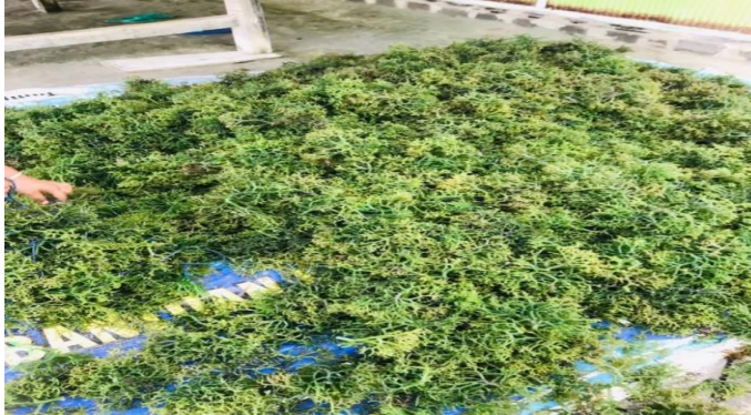
Gambar 3.2 Rumput Laut Katonik

Rumput jenis ini, adalah jenis rumput laut yang paling mahal, harga rumput laut jenis ini berkisar Rp. 50.000/kg.