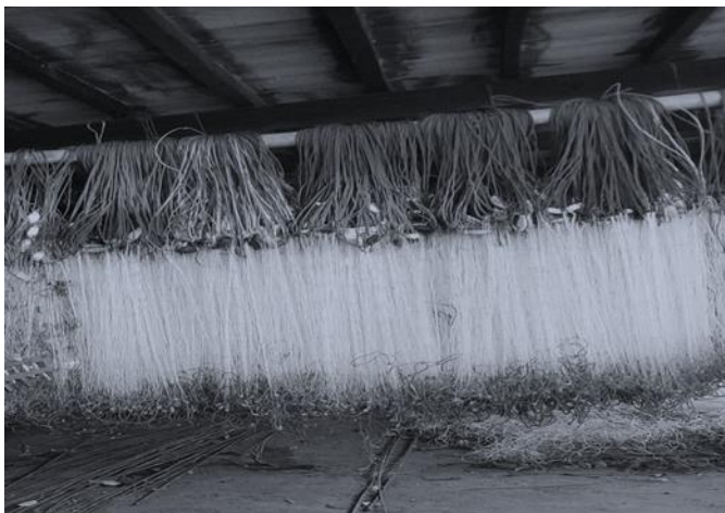
Gambar 1.4 Jaring ikan

Selain memanfaatkan ikan dan rumput laut sebagai mata pencaharian masyarakat Banko Tinggia juga memanfaatkan kepiting sebagai salah satu mata pencaharian. Proses penangkapan kepiting dilakukan pada saat air laut sedang surut di sore hari hingga malam hari dengan menggunakan jaring kepiting yang dipasang di sekitar pohon bakau. Alat yang digunakan untuk menangkap kepiting yaitu jarring atau perangkap kepiting. Sama dengan alat tangkap kepiting pada umumnya dan ukuran jaringnya berbeda dengan jaring yang digunakan untuk menangkap ikan.