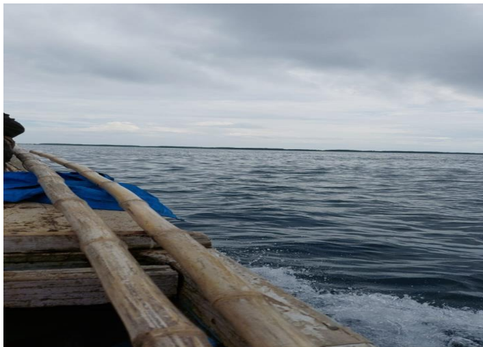
Gambar 2.2 Kondisi laut Bangko Tinggia

dusun yang termasuk dalam jangkauan desa tersebut di antaranya yaitu, Dusun Kampung Bugis, Dande-Dandere, Batu Ampara, dan yang terakhir Dusun Bangko Tinggia. Dusun Bangko Tinggia ini terpisah dengan ketiga dusun yang lain sehingga masyarakat yang mau berkunjung ke dusun tersebut harus menggunakan kapal. Jarak yang harus ditempuh untuk sampai ketiga dusun yang lain tersebut jika menggunakan kapal kurang lebih 10 menit sedangkan jika berjalan kaki itu harus menempuh jarak sejauh 4 kilometer.