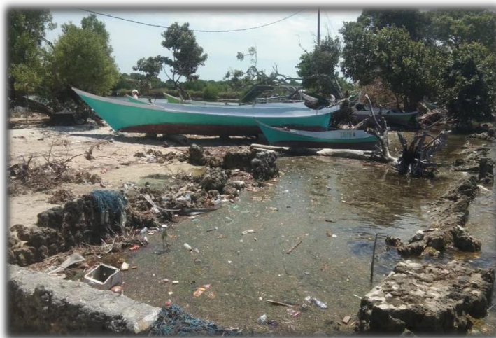
Gambar 2.4 Kondisi tanggul

masyarakat Bangko Tinggia. Tanggul di Dusun Bangko Tinggia di Gambar 2.4