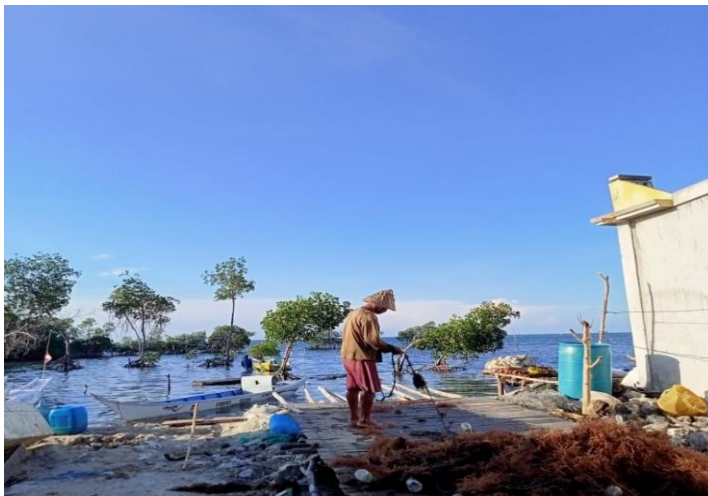
Gambar 3.3 Rumput Laut Spinosum

Rumput laut jenis ini salah satu spesies rumput laut merah yang berujung runcing dan ditumbuhi benjolan, berupa duri lunak. Permukaan tubuhnya licin berwarna coklat tua, hijau coklat, hijau kuning atau merah ungu.