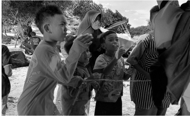
Gambar 1.5 Anak-anak yang sedang bermain

Sejak kecil sudah terbiasa ikut dalam aktivitas sehari-hari orangtua mereka, seperti memanen rumput laut, memancing ikan. Sehingga keterampilan yang anak-anak kuasai tidak jauh beda dari orangtua mereka, seperti kata pepatah “buah jatuh tak jauh dari pohonnya” yang mana berarti adanya kemiripan carabersikap, perilaku, dan pola berpikir antara orang tua dengan anak-anak mereka. Di mana sejak kecil mereka sudah terampil dalam menggunakan sampan, berenang, menebar jaring, menangkap (ikan, kepiting, udang, kerang, dan lain-lain). Hal tersebut membentuk kepribadian anak-anak dusun Bangko Tinggia yang berani, mandiri serta terampil. Selain terampil dalam mengendalikan perahu, anak-anak dusun Bangko Tinggia juga sangat terampil dalam membaca situasi dan kondisi pasang surut air laut.