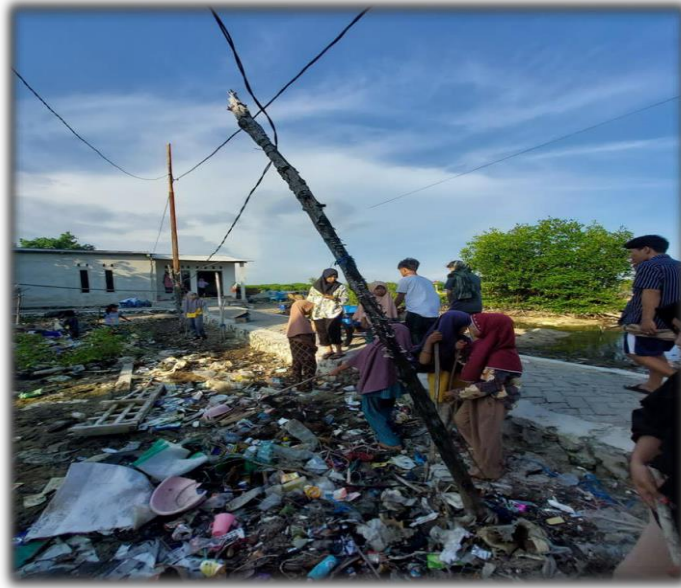
Gambar 2.3 Kondisi lingkungan sekitar

Lingkungan sekitar masyarakat Bangko Tinggia terlihat pada gambar 2.3.