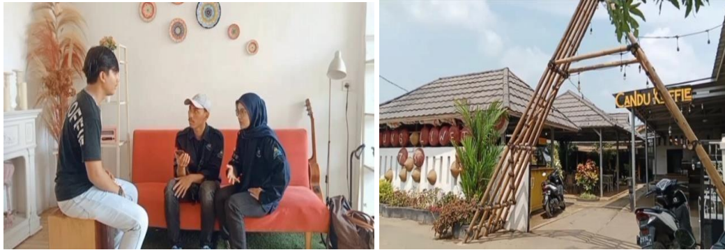
Gambar 1. Kunjungan Observasi Pada UMKM Candu Koffie di Lemahabang

Subjek kunjungan industri ini yaitu pemilik dan karyawan Candu Koffie. Kami melakukan wawancara dengan pemilik dan karyawan Candu Koffie untuk mendapatkan informasi yang lebih mendalam tentang biaya produksi dan penetapan harga jual yang digunakan oleh Candu Koffie.