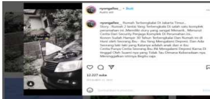
Gambar : Unggahan Instagram Ale Coward tentang rumah Tiko

Sebelumnya, Ale Cowad dengan akun Instagram @nyongallee mengunggah video rumah terbengkalai tersebut pada tanggal 13 Desember 2022 dengan views 1 juta kemudian dilanjutkan dengan membuat konten youtube yang mengajak Tiko berbicara tentang rumahnya pada tanggal 19 Desember 2022. Hal ini dipicu oleh rasa penasaran Ale pada rumah tersebut karena sering melewatinya ketika berangkat ke tempat kerja. Sedangkan Irfan merupakan sahabat Ale yang berhasil memviralkan kisah kehidupan Tiko dan rumahnya. Kedatangan Irfan ke rumah Tiko juga atas saran Ale.