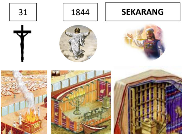
Gambar 1. Perkembangan Tiga Pokok Pengajaran

Jika Pola bangunan bait suci di bumi adalah pola dari yang disurga, itu berarti bahwa kegiatan pelayanannya Yesus memiliki “kesamaan” dalam fungsi sebagai imam besar untuk pendamaian.