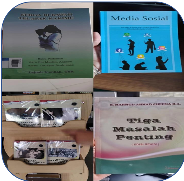
Beberapa buku cetakan Jemaat Ahmadiyah juga diperjualbelikan, baik di kalangan internal maupun di luar. Salah satunya adalah buku Surga di Bawah Telapak Kakimu , yang membahas kemuliaan seorang ibu serta perannya sebagai jalan menuju surga bagi anak yang shaleh dan shalehah.