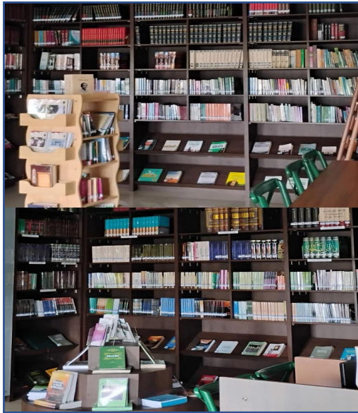
Koleksi buku di Perpustakaan, tersedia beragam buku novel, majalah, buku pendidikan fiqih akhlak, hingga Al-qur'an dengan berbagai bahasa