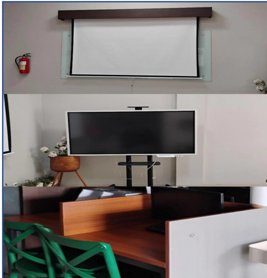
Fasilitas lengkap dengan proyektor, TV modern, beberapa PC yang dapat digunakan untuk mengakses internet, kualitas WIFI bagus.

Ruang santai Perpustakaan Nusrat Jahan menghadirkan fasilitas modern yang nyaman dan terawat. Tersedia area meeting dan diskusi yang bersih serta mendukung. Kualitas WiFi yang baik juga memastikan kelancaran presentasi atau sesi berbagi, termasuk kegiatan bedah buku bagi para pengunjung perpustakaan.