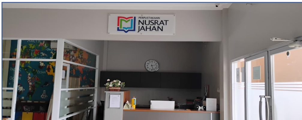
Tampak depan Perpustakaan Nusrat Jahan di Baitul Afiyat Kp. Babakan RT/RW 003/004, Kec.Kemang, Kabupaten Bogor,Jawa Barat 16310