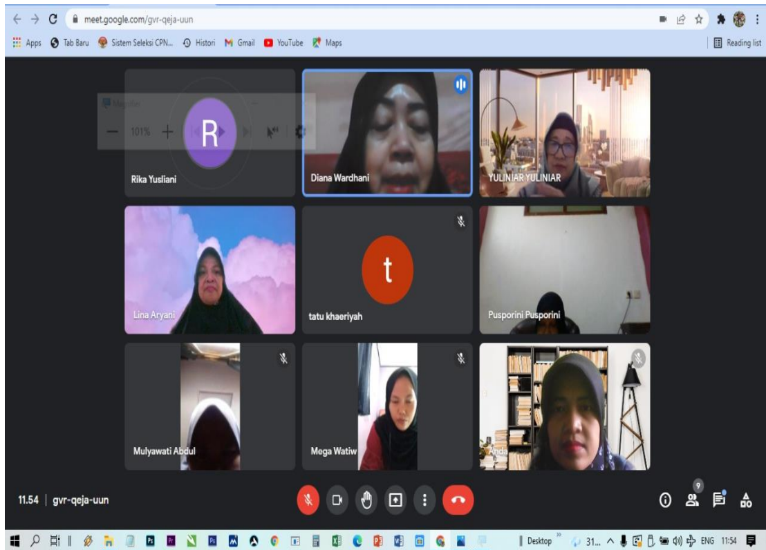
Gambar 2. Peserta Kegiatan Abdimas