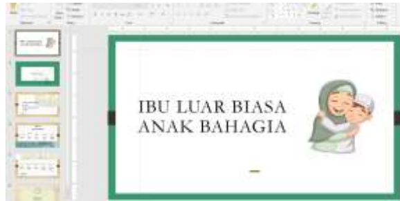
Gambar 5. Ibu Luar Biasa Anak Bahagia

Pada pertemuan ini membahas untuk menjadi ibu yang luar biasa sehingga anak bahagia berada didekat sang ibu. Sebagaimana kita tahu di masa remaja sudah mulai ada rahasia-rahasia yang terkadang tidak ingin diketahui oleh orang tua nya. Anak mulai menjaga jarak karena ada hal yang tidak sesuai dengan pandangannya. Sehingga pada materi ini akan dibahas bagaimana memposisikan diri sebagai anak. Sama seperti pertemuan sebelumnya evaluasi akan dilakukan diakhir kegiatan untuk menilai pemahaman akan materi sehingga dapat melanjutkan ke materi selanjutnya.