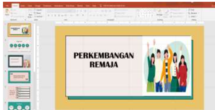
Gambar 1. Perkembangan Remaja

Pada pertemuan ini membahas perkembangan remaja mulai dari aspek fisik, kognitif, psikologis, dan sosial. Ibu-ibu diberi pengetahuan dasar terlebih dahulu terkait dengan perkembangan remaja agar ibu-ibu bisa melakukan penilaian terhadap anak remajanya pada saat ini anaknya berada di tahap/fase yang mana. Maka dapat memilih pola seperti apa yang sesuai dengan situasi atau kondisi anak remajanya tersebut. Sebagaimana pendapat Sarlito bahwa pola asuh orang tua sangat penting dalam membentuk sikap remaja (Sarlito, 2010). Sehingga orangtua harus secara seksama dan memahami pola asuh yang sesuai dengan keadaan anaknya.