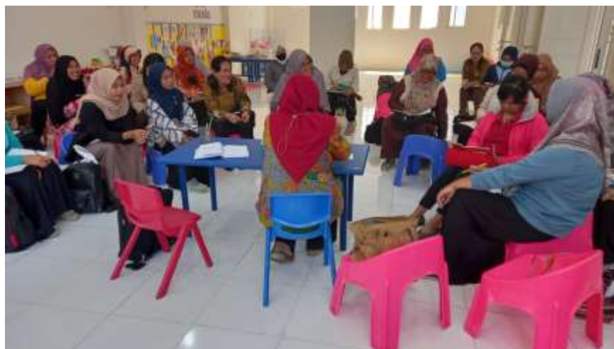
Gambar 8. Diskusi Kelompok Besar Dengan Ibu-Ibu Dusun Blendongan