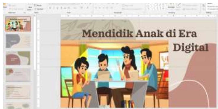
Gambar 2. Mendidik Anak di Era Digital

Pada pertemuan ini membahas mendidik anak di era digital atau digital parenting . Dalam pertemuan lebih banyak membahas bagaimana peran orangtua sedangkan dipertemuan sebelumnya lebih fokus pada remajanya sehingga dipertemuan ini ibu-ibu akan banyak mendapatkan materi tentang mendidik anak di era digital dan mempelajari banyak hal tentang era digital. Pemanfaatan media sosial juga dibahas dalam pertemuan kali ini. Sama seperti dipertemua