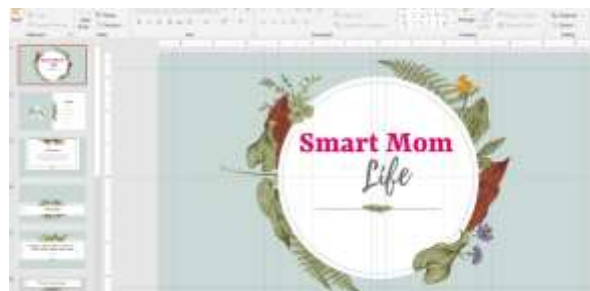
Gambar 6. Tips dan Trik Menjadi Ibu Masa Kini

Pertemuan ini membahas tentang tips & trik ibu smart sebagai ibu masa kini yang sesuai dengan keadaan remaja masa kini. Melatih ibu-ibu untuk mampu mengenali anaknya dan mampu mengendalikan diri sesuai dengan keadaan anaknya.