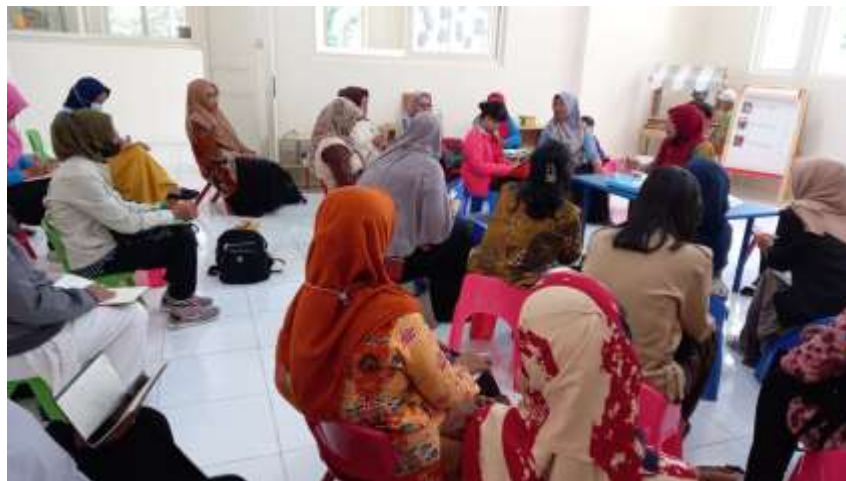
Gambar 7. Pemberian Materi Dengan Ibu-Ibu Dusun Bendongan

Melalui pendampingan ini mulai adanya perubahan dan peningkatan kedekatan antara ibu dan anak remajanya serta memberikan pemahaman dan juga trik & tips menyelesaikan masalah dengan anak remajanya. Hal ini didapatkan dari hasil asesmen yang dilakukan kepada anak-anak remajanya. Penguatan peran ibu sebagai orangtua sangat di butuhkan dalam mendidik anak remaja di zaman sekarang. Ibu sebagai lingkungan pertama dan utama bagi anak dan memegang peranan penting dalam mendidik anak dalam perkembangannya. Sebagai ibu dari anak-anaknya, ibu mempunyai peranan untuk mengurus rumah tangga, sebagai pengasuh dan pendidik anak-anaknya, pelindung dan sebagai salah satu kelompok dari peranan sosialnya serta sebagai anggota masyarakat dari lingkungannya, disamping itu juga ibu dapat berperan sebagai pencari nafkah tambahan dalam keluarganya (Bachrie, 2014). Itulah kenapa ibu-ibu juga harus melek akan teknologi dan mengikuti serta berperan aktif dalam perkembangan teknologi.