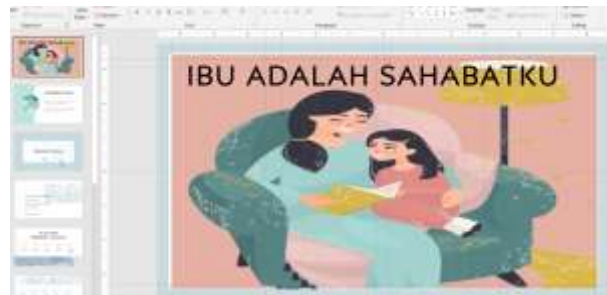
Gambar 4. Ibu Sahabat Bagi Anak

Pada pertemuan ini membahas ibu yang berperan bukan hanya sebagai ibu/orangtua juga sebagai sahabat bagi anaknya. Tidak mudah untuk ibu menjadi sahabat anak. Pemahaman dari materi-materi sebelumnya adalah pengetahuan yang mendukung untuk menjadi sahabat bagi anak remaja. Hal ini agar para ibu bisa menjadi sahabat anak sehingga dalam mendidik anak mendapatkan keterbukaan dan kepercayaan dari anaknya. Seperti pertemuan sebelumnya akan melanjutkan materi setelah melakukan evaluasi dari materi dipertemuan ini.