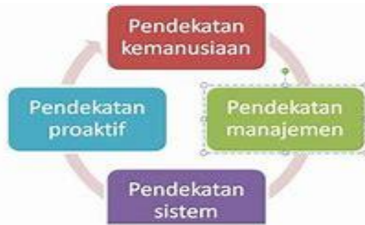
Gambar 2. Siklus Manajemen SDM