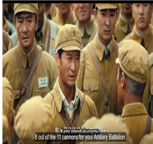
Gambar 2. Wu Qianli Mensupport Teman Sebangsanya yang Ikut Berperang