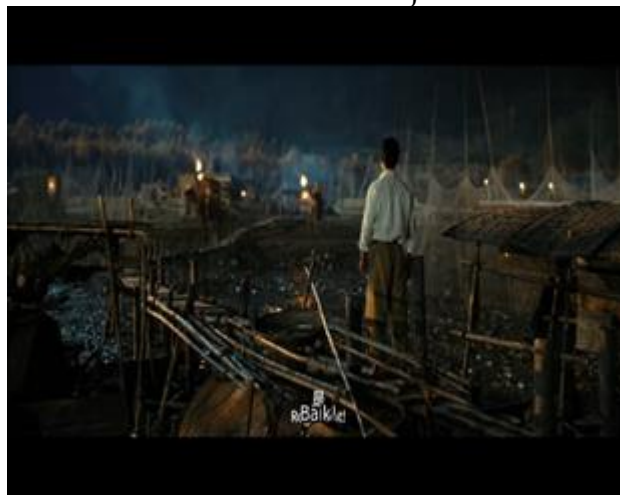
Gambar 4. Wu Qianli Memutuskan Berkorban Waktu dan Nyawa Mengikuti Perang Demi Negara

Nasionalisme memandang warga negara hanya dilahirkan untuk berkorban baik hidup dan mati untuk tanah air adalah sikap dimana warga negara berkorban baik kepentingan sendiri maupun berkorban harta, benda dan nyawa untuk kemerdekaan tanah air dan kemajuan tanah air.