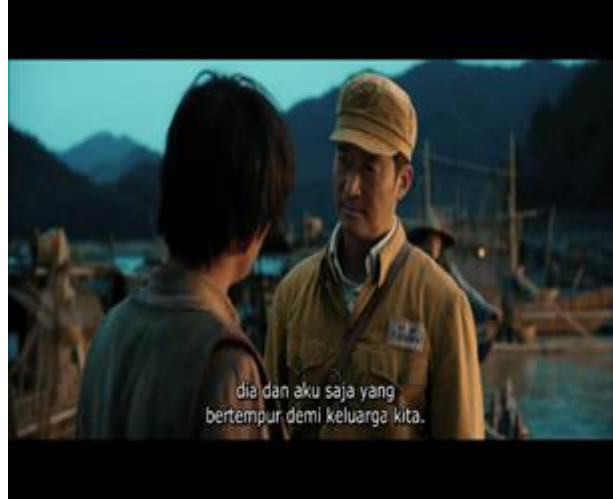
Gambar 7. Wu Qianli yang Memiliki Motif agar Keluarga dan Bangsa China Terselamatkan

五万里 : 我要跟你打仗去。 五前里 : 大哥说我们两把孩打的仗都打了, 不让你打。 五前里 : 包子等我回来。