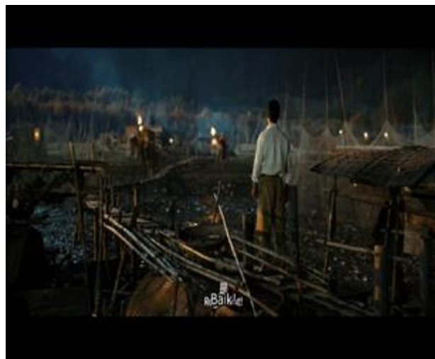
Gambar 1. Wu Qianli Memutuskan Ikut Berperang Demi Melindungi Bangsa