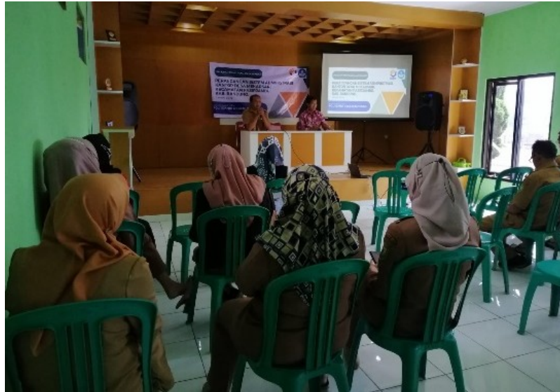
Gambar 5. Pelatihan Sistem Kearsipan Manual dan Elektronik

aparatur desa yang mengelola administrasi desa, dimulai dari aparatur di Kantor Desa hingga pengurus RW dan RW di Desa Mekarsari. Mengingat Dana Desa semenjak tahun 2019 diprioritaskan untuk Bantuan Langsung Tunai akibat dampak pandemi Covid-19, maka untuk mengatasi permasalahan tentang keterbatasan kapasitas aparatur Kantor Desa Mekarsari, diberikan pelatihan dalam pengoperasian sistem kearsipan manual dan elektronik yang telah dibuat. Dokumentasi kegiatan pelatihan ditunjukkan pada gambar 5.