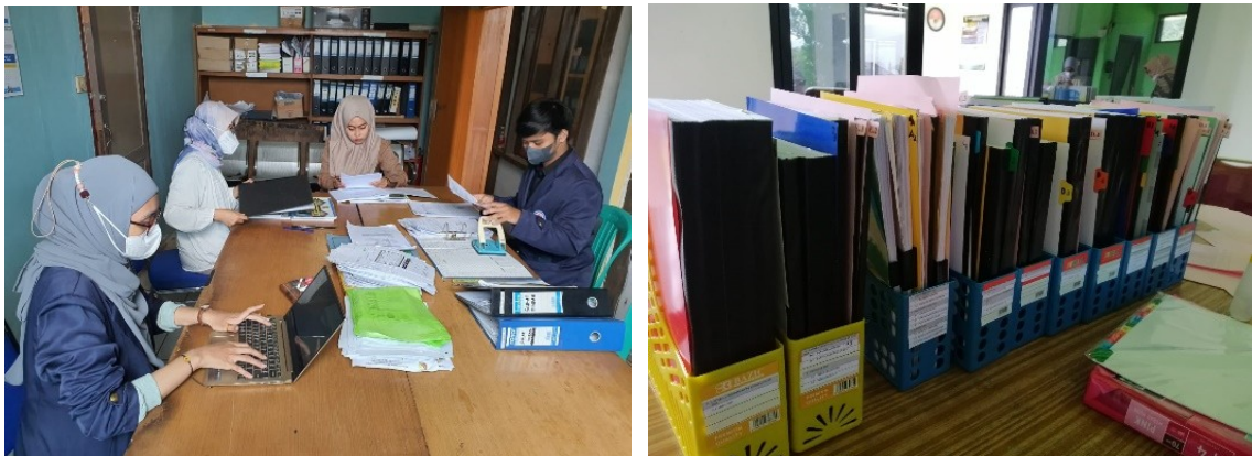
Gambar 3. Proses Pembuatan Sistem Kearsipan dan Sampel Hasilnya

nama orang, nama masalah, organisasi, tempat, ataupun angka bergantung atas informasi yang terkandung di dalam dokumen yang bersangkutan. Karena pada hakekatnya indeks merupakan kunci utama penemuan kembali. Misalnya, seseorang akan mencari arsip tentang data umum kepegawaian atau daftar inventaris, indeks yang digunakan sebagai kunci penemuan kembali dapat berupa nama pegawai atau nama barang jika menyangkut arsip inventaris. Disinilah tim pengusul berperan. Tim PkM membantu mitra dalam membuat sistem kearsipan manual yang efektif dan sesuai dengan kebutuhan pekerjaan sehari-hari di Kantor Desa Mekarsari sebagaimana yang ditunjukkan pada gambar 3.