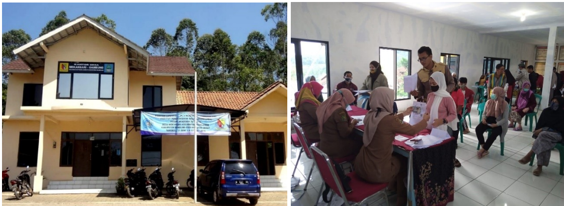
Gambar 1. Kantor dan Pelayanan Masyarakat Desa Mekarsari

Oleh karena itu walaupun jaraknya dekat dengan pusat pemerintahan Provinsi Jawa Barat, pengelolaan administrasi desa yang belum tertib dan memadai sering ditemukan di daerah kabupaten, salah satunya di Kantor Desa Mekarsari, yang beralamat di Jalan Gambung No. 2, Mekarsari, Kecamatan Pasirjambu, Kabupaten Bandung, Jawa Barat. Desa Mekarsari adalah salah satu dari 10 desa yang ada di Kecamatan Pasirjambu dengan penyelenggaraan pemerintahannya yang meliputi 4 dusun, 11 RW dan 30 RT. Total jumlah penduduk yang tercatat adalah 7.414 orang, dengan kepadatan penduduk sekitar \pm 1.267 jiwa / km 2 . Sesuai dengan Undang-Undang Nomor 32 Tahun 2004 tentang Pemerintahan Daerah dan Peraturan Daerah Kabupaten Bandung Nomor 11 Tahun 2007 tentang Pedoman Organisasi Pemerintahan Desa, dan Perangkat Desa, dalam kedudukan dan pelaksanaannya sebagai pemerintah desa, Kepala Desa dibantu oleh perangkat desa yang terdiri dari Sekretaris Desa, Kepala Seksi Pemerintahan, Kepala Seksi Kesejahteraan, Kepala Seksi Pelayanan, Kepala Urusan Keuangan, Kepala Urusan Umum dan Tata Usaha, Kepala Urusan Perencanaan, serta Kepala Dusun (Mekarsari, 2016). Seluruh perangkat desa dibentuk bukan untuk melayani dirinya sendiri atau sekelompok orang, tapi untuk melayani masyarakat secara efektif, efisien, demokratis, partisipatif dan akuntabel.