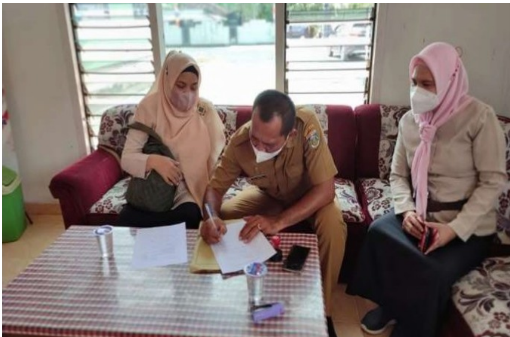
Gambar 2. Penandatanganan MOU dengan Pemerintah Desa Swastika Buana

Kampung Swastika Buana terletak di Kecamatan Seputih Banyak Kabupaten Lampung Selatan ,desa ini merupakan desa yang mempunyai potensi wisata yang sangat bagus seperti adanya danau dan bendungan.Tempat ini sering di kunjungi oleh masyarakat setempat dan masyarakat dari luar kampung. Potensi wisata ini merupakan aset yang sangat potensial untuk di kembangkan. Pengembangan potensi wisata ini harus di barengi dengan kemampuan masyarakatnya dalam melayani para pengunjung atau wisatawan sehingga tempat wisata bisa meningkatkan kemampuan desa adalah dalam hal ekonomi dan sosial. Pengembangan wiasata air akan berdampak positif dan negatif. Dampak negatifnya adalah terjadinya kecelakaan di air seperti henti jantung mendadak yang perlu penanganan segera oleh masyarakat awam seperti pengelola wisata. Pemerintah desa siap melakukan pengembangan tersebut.