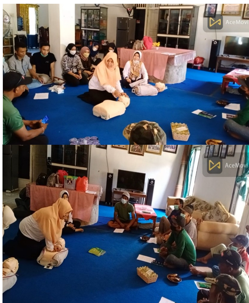
Gambar 4. Pelatihan Bantuan Hidup Dasar

Keinginan dan keikutsertaan masyarakat dalam mengembangkan diri untuk memberikan pelayanan terbaik bagi pengunjung tempat wisata merupakan hal yang utama dalam pengembangan wisata dan daerah Kampung Swastika Buana, sehingga masyarakat siap dalam penanganan koban yang mengalami HJM pada area wiasta terutama di daerah danau/ bendungan Tirta Gangga Kampung Swastika Buana Kecamatan Seputih Banyak Kecamatan Lampung Tengah.