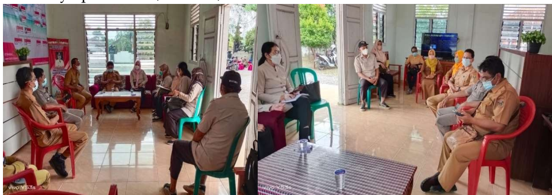
Gambar 1. Survei Lokasi dan Diskusi dengan Pemerintah Desa Swastika Buana