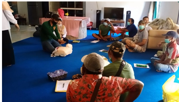
Gambar 6. Pelaksanaan Evaluasi Kegiatan Bantuan Hidup Dasar