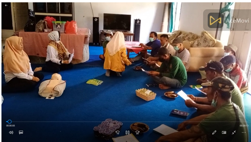
Gambar 3. Penyuluhan Bantuan Hidup Dasar