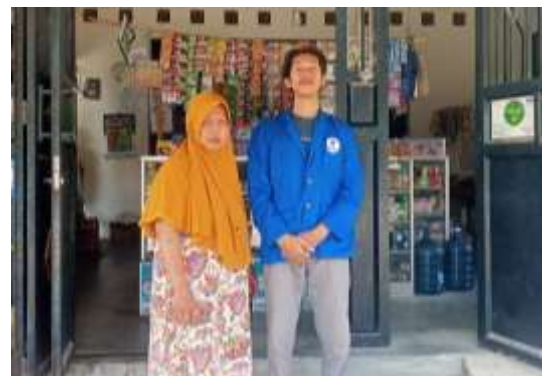
Gambar 2. Pengabdian Masyarakat di Toko Serasi

Pengabdian ini akan menggunakan aplikasi akuntansiku untuk menyusun laporan keuangan dan adobe acrobat reader untuk pengisian e-form SPT tahunan. Pengabdian dilakukan di toko serasi yang telah menjalankan usaha toko kelontong selama 5 tahun dan berlokasi di Desa Newung, Kabupaten Sragen. Kegiatan pengabdian ini dilakukan melalui kunjungan langsung ke lokasi mitra, dengan pelaksanaan yang terdiri dari beberapa tahapan: observasi pada 28 September 2024, sosialisasi pada 4 sampai 5 Oktober 2024, pelatihan yang dimulai pada 6 hingga 10 Oktober 2024, dan evaluasi pada tanggal 11 Oktober 2024.