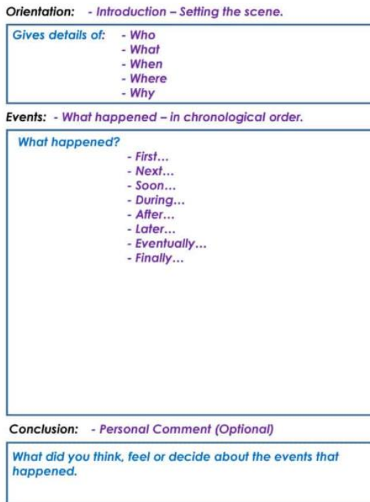
Gambar 3. Contoh Guided Writing dengan Prompts