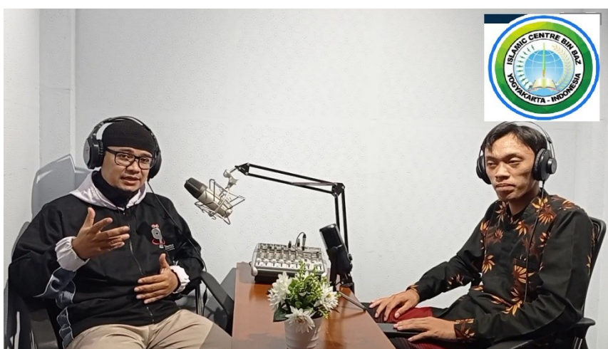
Gambar 6. Program Kreatif Hasil Pendampingan

Dokumentasi diatas menunjukkan program-program kreatif hasil pendampingan yang telah mengudara dan tersimpan secara on demand di youtube Channel Binbaz TV. Mulai dari program Tablig akbar masyaikh dari timur tengah, Talkshow keluarga, Kajian Rutin tentang pendidikan keluarga, drama keluarga, hingga acara podcast keluarga. Dimana program-program diatas adalah bagian dari dakwah digital kreatif yang diharapkan dapat menanamkan pendidikan pada keluarga muslim dimanapun yang menyaksikannya.