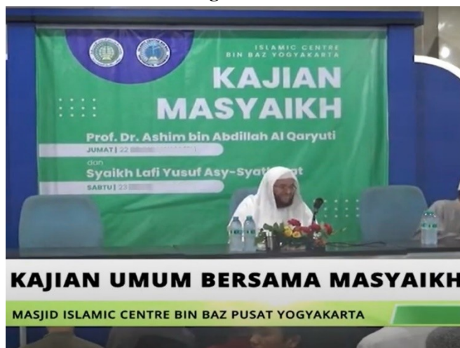
Gambar 5. Program-Program Kreatif

Dokumentasi diatas merupakan proses pengajaran kepada kru Binbaz TV tentang bagaimana cara menggunakan media digital untuk berdakwah secara efektif meliputi pemilihan perangkat yang canggih dan aplikasi terbaru yang mendukung, output gambar dan audio yang berkualitas sehingga dakwah pendidikan keluarga muslim bisa sampai kepada audien dengan baik dan efisien melalui stasiun televisi digital Binbaz TV.