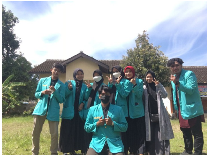
Gambar 8. Tim Kegiatan Pengabdian