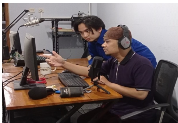
Gambar 4. Proses Pengajaran kepada Kru Binbaz TV

Praktik dakwah digital kepada semua kru mulai diterapkan di Binbaz TV. Pada tahap ini pendamping akan mengupgrade aplikasi paska produksi yang terbaru dan lebih canggih sehingga program yang dihasilkan akan berkualitas terbaik dan mudah diterima oleh keluarga muslim dimanapun berada. Satu persatu aplikasi yang ada di cek oleh pendamping dan di up grade menyesuaikan spesifikasi dari perangkat yang ada. Pendamping memonitor didalam ruang studio paska produksi dan menginstal aplikasi yang relevan.