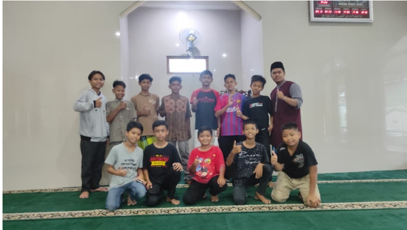
Gambar 7. Pendampingan kepada Remaja Muslim Komunitas Masjid

tersebut didokumentasikan bahkan disiarkan dalam informasi terkini pada siaran Binbaz TV. Baik dalam bentuk berita maupun feature dokumenter. Diantaranya adanya pengajian rutin, pendampingan anak-anak dan remaja muslim komunitas masjid serta penanaman nilai-nilai pendidikan islam pada anak-anak. Semuanya adalah bagian dari penanaman pendidikan keluarga muslim.