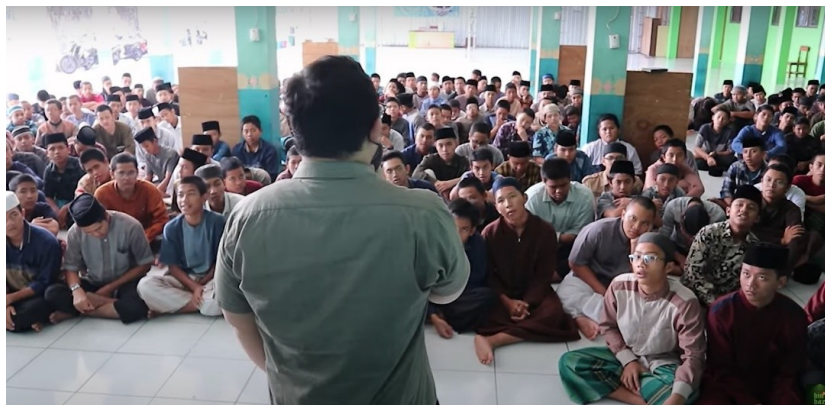
Gambar 9. Pendampingan kepada Masyarakat Sekitar