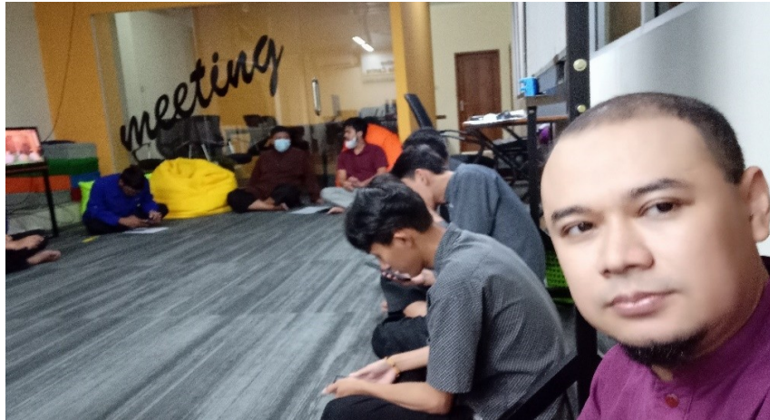
Gambar 3. Tindak Lanjut Kegiatan

Dokumentasi diatas merupakan pengarahannya untuk penerapan dakwah digital yang kreatif inovatif dengan muatan pendidikan keluarga muslim. Kegiatan ini merupakan tahapan pertama pendampingan tim produksi Binbaz TV. Selanjutnya, pendampingan dilakukan dengan perencanaan pra produksi bersama seluruh kru dari produksi, program siaran, dan kru teknis Binbaz TV dengan memaparkan program, rencana rundown produksi dari pra hingga paska: