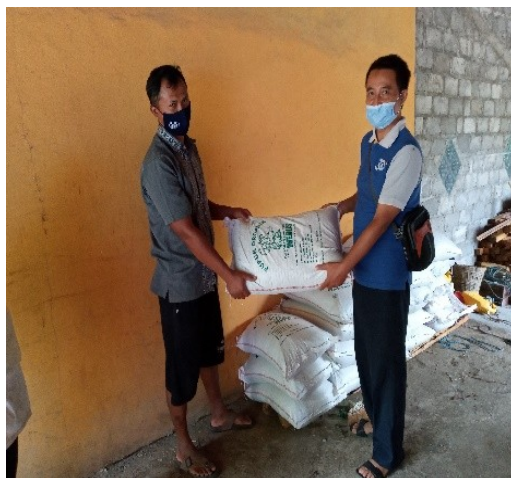
Gambar 8. Penyerahan secara Simbolik Bantuan Pupuk