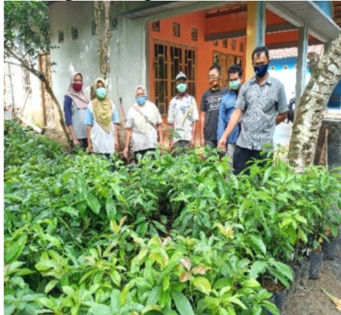
Gambar 6. Bibit Alpukat Mentega dan Kendil

tentang kebutuhan tanaman alpukat diperoleh masukan bahwa para anggota lebih tertarik bibit jenis alpukat mentega. Alasannya jenis ini lebih gurih dan menurut pedagang alpukat yang sering datang harga di pasaran juga lebih tinggi dan lebih diminati. Maka penyediaan bibit terdiri dari 2 jenis yaitu jenis mentega sebanyak 200 bibit dan 175 jenis kendil. Hal ini didasari pertimbangan keduanya memiliki kelebihan masing-masing.