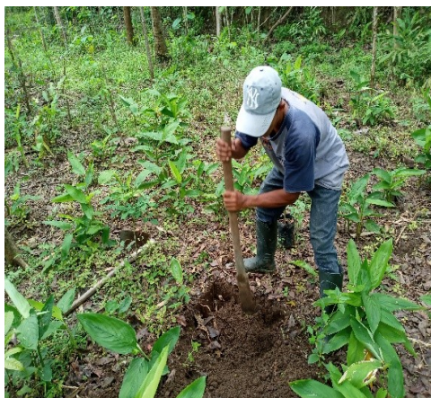
Gambar 4. Penggalian Lubang Tanaman Alpukat Kendil