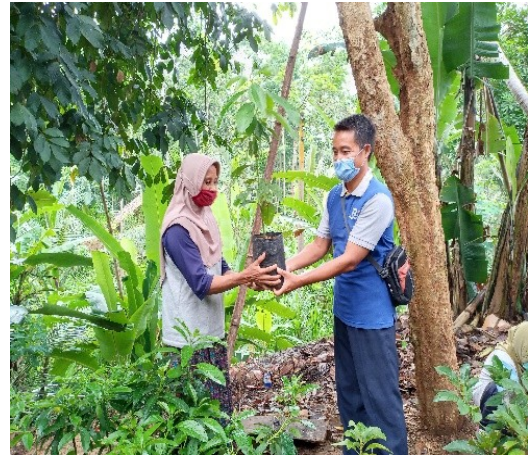
Gambar 7. Penyerahan secara Simbolik Bibit Alpukat