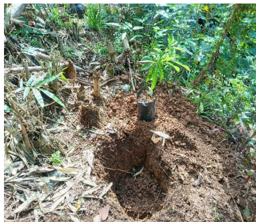
Gambar 5. Pemberian Pupuk pada Lubang Alpukat Kendil

Dilanjutkan dengan pemberian pupuk di dasar lubang sebelum bibit alpukat di tanam. Pupuk ditutup dengan tanah agar akar bibit alpukat tidak menyentuh pupuk secara langsung. Kemudian tanah galian bagian atas dimasukkan ke dalam lubang hingga setengah lubang. Bibit alpukat dimasukkan ke dalam lubang yang sudah terisi tanah galian setengahnya. Bibit diletakkan dalam kondisi masih didalam polibag. Setelah posisi bibit diletakkan tegak di dalam lubang baru plastik polibag disobek menggunakan pisau atau gunting.