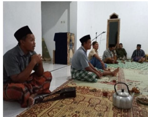
Gambar 3. Focus Group Discussion (FGD)