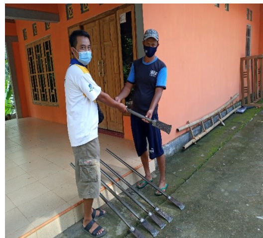
Gambar 9. Penyerahan secara Simbolik Alat Penggalan