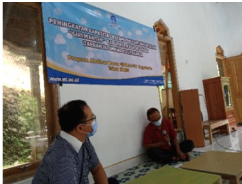
Gambar 2. Penyuluhan Mengenai Efektivitas Organisasi