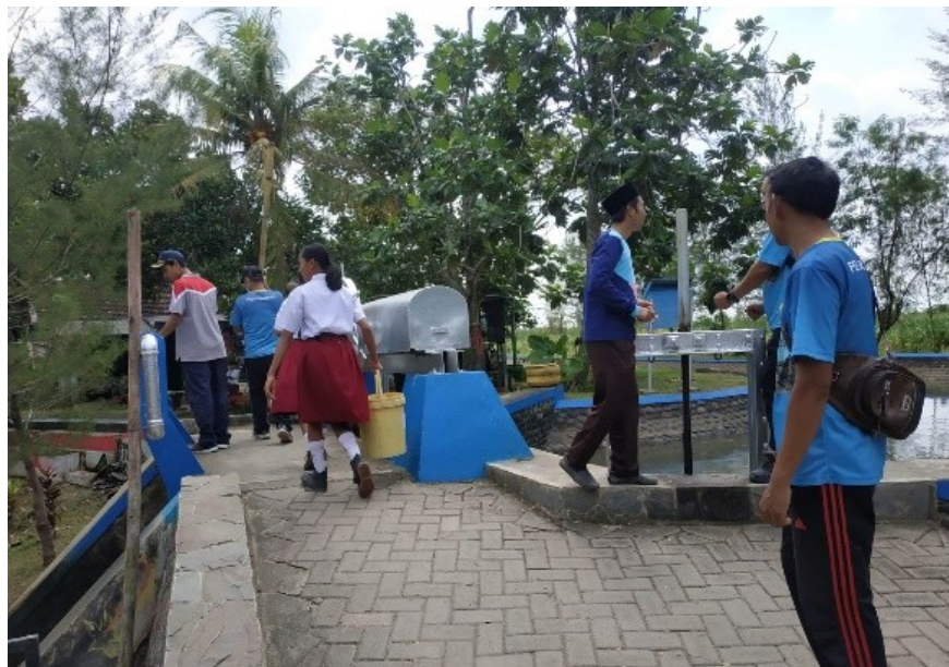
Gambar 2. Tahapan Kuratif

Tahap Kuratif yaitu melakukan perbaikan terhadap kondisi sungai yang kotor. Proses ini dilakukan dengan mengajak siswa untuk membersihkan sungai yang ada di sekitarnya terutama sampah plastic. Sampah plastic merupakan sampah dominan yang banyak ditemukan di sekitar sungai. Jenis sampah ini sangat sulit terurai oleh alam. Oleh sebab itu perlu dilakukan pengambilan sampah di sekitar sungai secara berkala agar kondisi Daerah Aliran Sungai selalu terjaga kebersihannya.