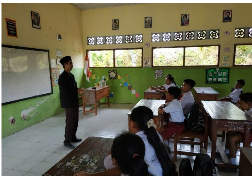
Gambar 1. Tahapan Promotif kepada Siswa SDN 1 Wringintelu

Pelaksanaan program sekardadu dibagi kedalam 5 (lima) tahapan yang dilakukan di Lembaga penelitian. Tahapan yang pertama yakni Promotif (sosialisasi). Pada tahap ini dilaksanakan pemberian materi kepada siswa sekolah dasar sebagai subjek utama sosialisasi dengan memperkenalkan daerah aliran sungai, manfaat sungai, factor pendukung kelestarian sungai hingga potensi wisata dari adanya sungai. Pada tahap ini difokuskan memberikan pemahaman tentang kebersihan sungai yang ada di sekitar sekolah. Diharapkan dengan sosialisasi ini para siswa mampu mengembangkan pemahaman akan pentingnya menjaga sungai.