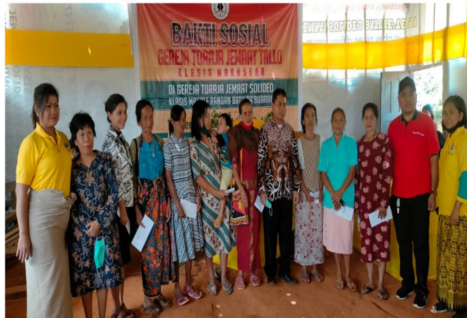
Gambar 3. Pemberian Bingkisan