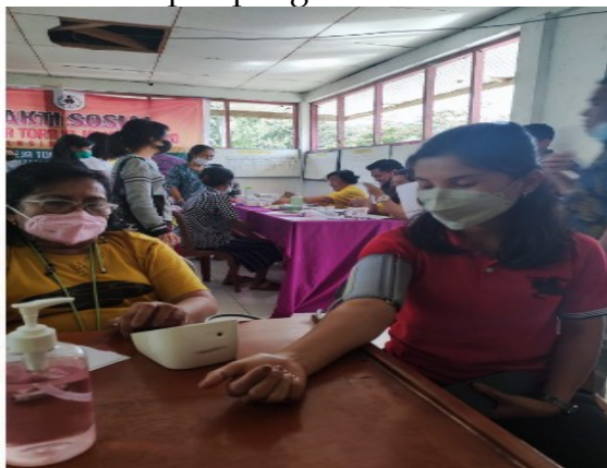
Gambar 2. Pemeriksaan Tensi

Layanan komunikasi yang santun dari tim pelaksana kegiatan baksos dan dari para dokter dan paramedik terhadap pasien membangkitkan suasana kebatinan yang tenang dan senang sehingga terbangun motivasi dan semangat warga masyarakat dan warga gereja untuk membiasakan diri melakukan pemeriksaan kesehatan pada dokter atau tenaga kesehatan ketimbang memelihara kebiasaan pada pengobatan alternatif.