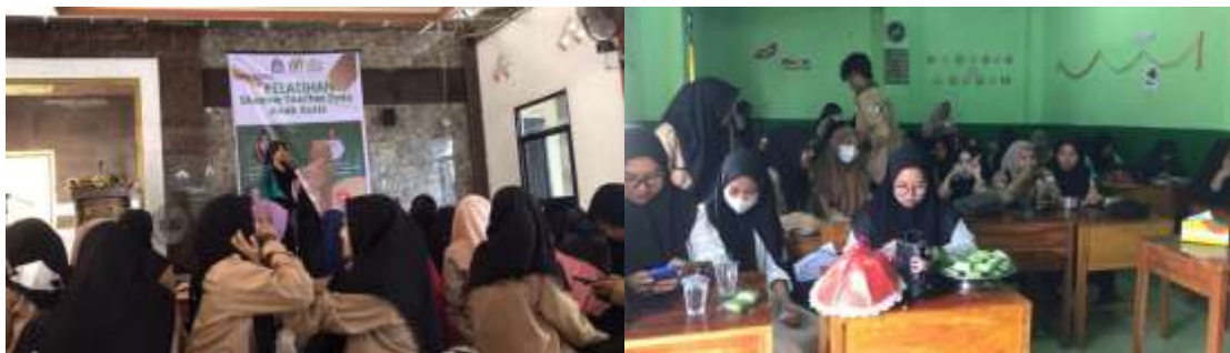
Gambar 1. Kegiatan Pelatihan

Proses evaluasi merupakan tahap akhir pelatihan kepada guru-guru raudhatul athfal ashabul kahfi kota Parepare. Pada tahapan ini, guru diberikan tugas membuat program pembelajaran individual dan cara assesmen agar dapat digunakan oleh guru pada anak autis di kelas regular.