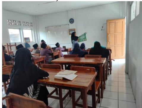
Gambar 3. Tindakan 2

Setelah tindakan pertama yaitu pembuatan tata tertib maka tindakan selanjutnya adalah sosialisasi tata tertib dan penerapan tata tertib di MDTA Miftahul Ula. Menurut Arikunto (Arikunto, Suharsimi, 2012) agar tata tertib madrasah dapat berfungsi seperti yang diharapkan, Tata tertib harus diperkenalkan kepada santri secara jelas.