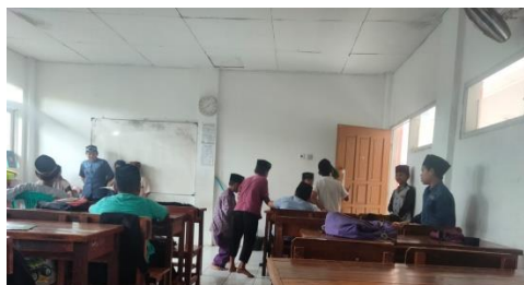
Gambar 1. Sebelum Tindakan

Data di atas menunjukkan bahwa santri kelas 3 MDTA Miftahul ula sangat perlu bimbingan karakter disiplin, dari indikator dapat dilihat masih banyak santri yang keluar masuk tanpa izin, berbicara kasar, berpakaian kurang rapi, bermain pada saat pembelajaran sedang berlangsung, makan bukan pada waktu dan tempat yang tepat, dan mengobrol saat pembelajaran.