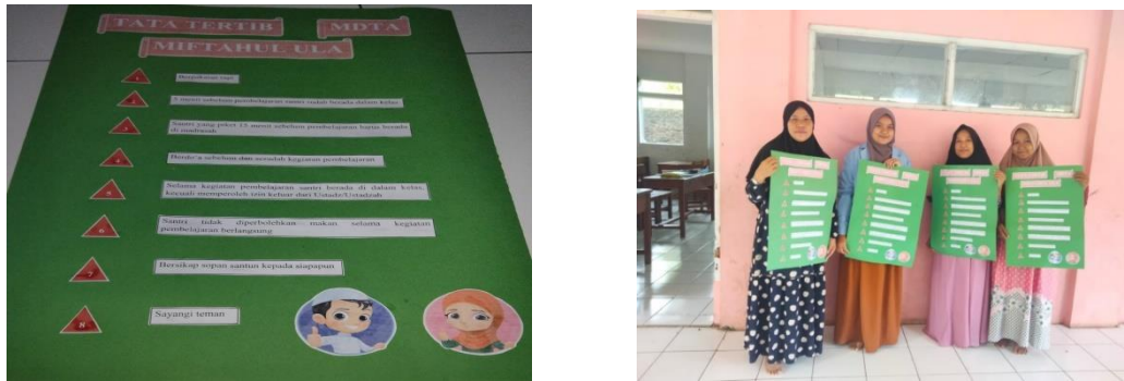
Gambar 2. Tindakan 1