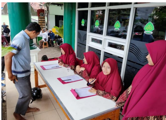
Gambar 2. Kegiatan Pendaftaran Penyuluhan Kepada Orang Tua Murid

Secara umum kegiatan dibagi beberapa tahapan. Pertama tahap penyuluhan(pembukaan), pendalaman materi dan evaluasi sebanyak 2 kali. Total waktu yang dibutuhkan sebanyak 550 menit atau sebanyak 9 jam 2 menit. Kegiatan pendalaman materi dibantu oleh beberapa guru sekolah.