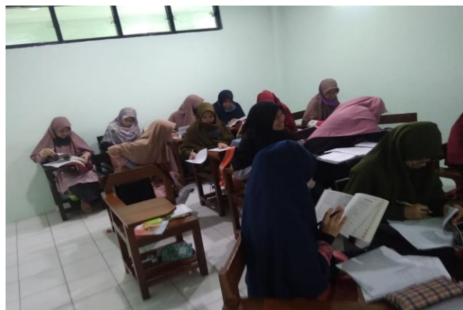
Gambar 4. Kegiatan Pendalaman Materi Dikelas

Kegiatan penyuluhan kepada orang tua murid, dilakukan agar program yang sudah direncanakan oleh sekolah dan pelaksana pengabdian kepada masyarakat berjalan dengan maksimal, tanpa dukungan dan pengawasan orang tua, hasil yang diperoleh kurang maksimal. Kegiatan dilakukan dengan pemberian ceramah dan pemaparan hasil pretest siswa, yang meliputi tes Pengetahuan dan pemahaman Umum, pengetahuan Kuantitatif, pemahaman bacaan dan menulis kemampuan bahasa Inggris. Hasil secara umum nilai siswa mendapat rata rata 58, hal ini menandakan perlunya persiapan yang harus dilakukan dan pembelajaran literasi bahasa yang mumpuni (Sahrazad, S.,dkk., 2021). Perbaikan nilai dan peningkatan pemahaman materi yang akan diujikan harus dilaksanakan secara berkesinambungan. Selain peningkatan pemahaman materi, perlu adanya pembelajaran daring (Widiyanto, S.dkk., 2021), demikian juga dengan pembelajaran bahasa Indonesia yang harus ditekankan dalam pemahaman bacaan (Ati, A. P.,dkk, 2021)