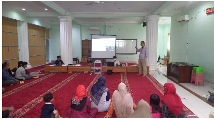
Gambar 3. Kegiatan Penyuluhan Kepada Orang Tua Murid

Kegiatan penyuluhan kepada orang tua murid, dilakukan agar program yang sudah direncanakan oleh sekolah dan pelaksana pengabdian kepada masyarakat berjalan dengan maksimal, tanpa dukungan dan pengawasan orang tua, hasil yang diperoleh kurang maksimal. Kegiatan dilakukan dengan pemberian ceramah dan pemaparan hasil pretest siswa, yang meliputi tes Pengetahuan dan pemahaman Umum, pengetahuan Kuantitatif, pemahaman bacaan dan menulis kemampuan bahasa Inggris. Hasil secara umum nilai siswa mendapat rata rata 58, hal ini menandakan perlunya persiapan yang harus dilakukan dan pembelajaran literasi bahasa yang mumpuni (Sahrazad, S.,dkk., 2021). Perbaikan nilai dan peningkatan pemahaman materi yang akan diujikan harus dilaksanakan secara berkesinambungan. Selain peningkatan pemahaman materi, perlu adanya pembelajaran daring (Widiyanto, S.dkk., 2021), demikian juga dengan pembelajaran bahasa Indonesia yang harus ditekankan dalam pemahaman bacaan (Ati, A. P.,dkk, 2021)