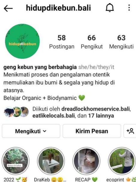
Gambar 5. Halaman depan IG Kebun Surgawi Mengwi

Prinsip Desain yang penulis dan desainer grafis pilih untuk mengerjakan proyek ini adalah konsep Keseimbangan (Balance). Keseimbangan berkaitan dengan distribusi elemen desain pada sebuah komposisi yang dapat membuat elemen-elemen tersebut terlihat nyaman di mata. Keseimbangan banyak berhubungan dengan 'bobot' visual. Bobot visual mengacu kepada intensitas suatu elemen visual yang bisa dilihat dari besar/kecil nya ukuran, ketebalan atau ketipisan garis, gelap/terang warna, dsb. Apabila ada keseimbangan yang baik di dalam sebuah komposisi, maka sebuah desain akan menjadi nyaman dilihat. Ada tiga jenis keseimbangan yang paling umum dikenal, yaitu keseimbangan simetris, keseimbangan asimetris, dan keseimbangan radial.