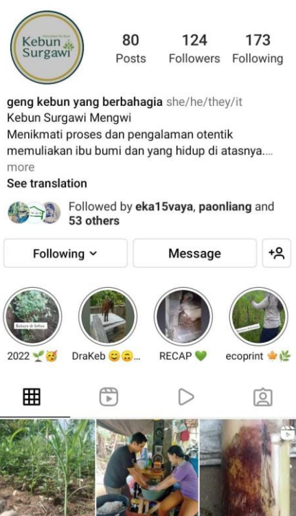
Gambar 12. The Gardener's Contents of Taking Over

Akan tetapi di luar daripada itu secara umum program edukasi dan pemberian jasa cukup berhasil karena meningkatnya respon positif dari masyarakat maupun para follower. Terbukti beberapa saat setelah selesainya program ini ada satu perusahaan pelayanan pendidikan holistik bernama Sancaya Indonesia (Education and School Management Consultant) yang mengajak Kebun Surgawi bekerja sama.