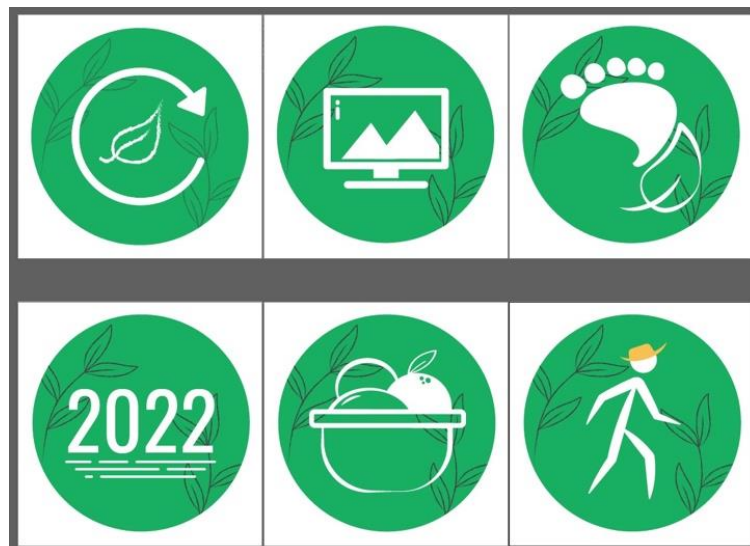
Gambar 8. Aset Desain yang Sudah Direvisi untuk Kaver Highlight (1)