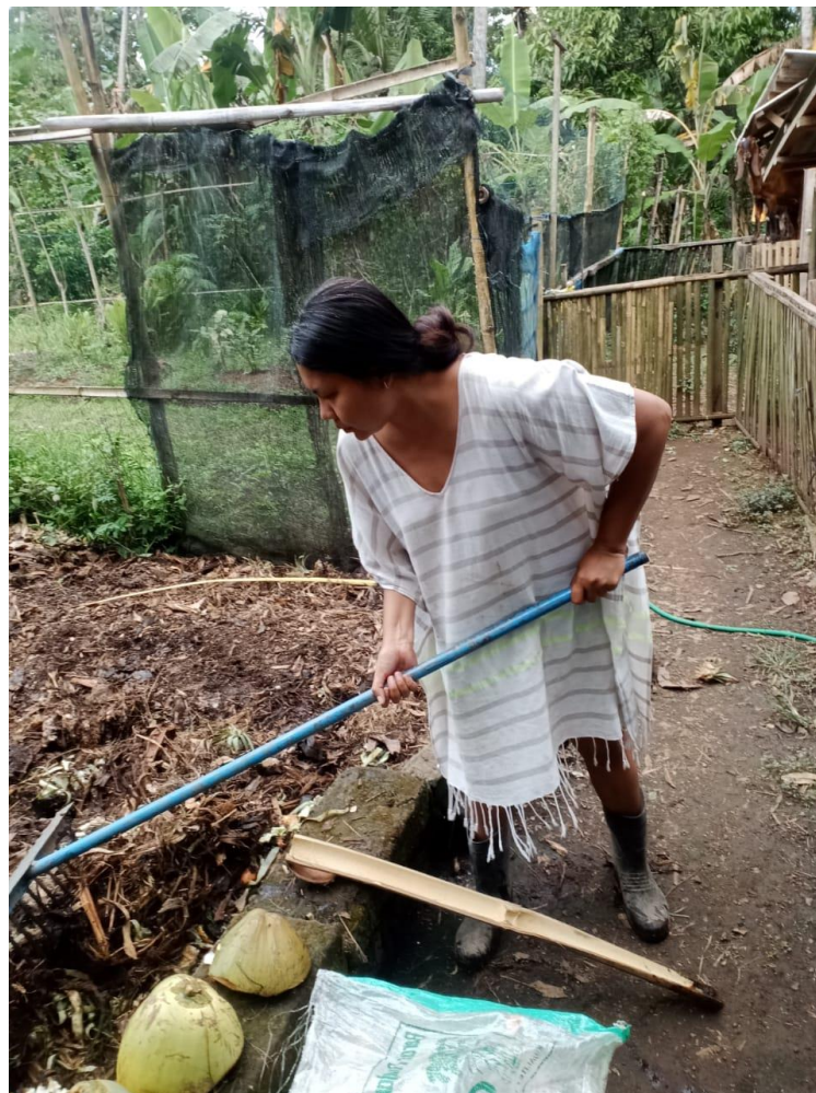
Gambar 4. Aktivitas di Kebun