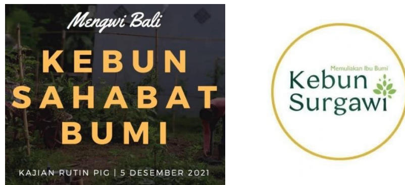
Gambar 1. Logo Kebun Sahabat Bumi Menjadi Kebun Surgawi