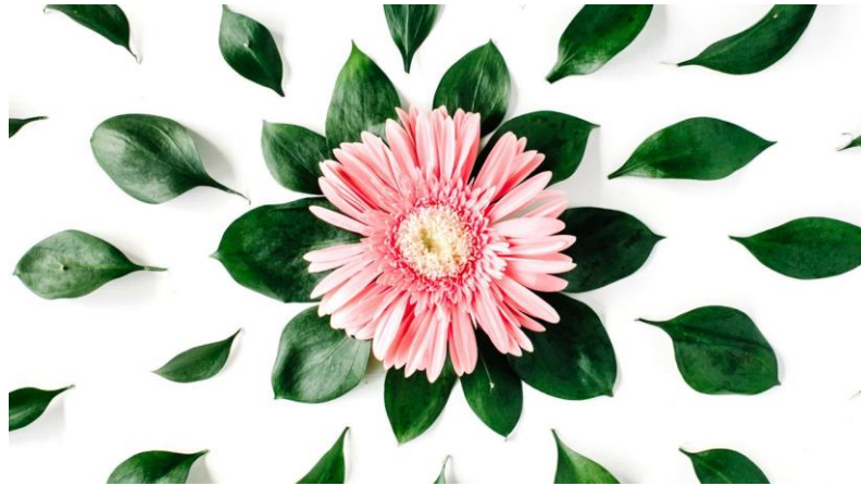
Gambar 6. Contoh Keseimbangan Radial

keseimbangan radial menciptakan titik fokus yang kuat ( focal point ) karena mengarahkan mata audiens ke titik pusat yang diciptakan melalui penempatan elemen desain tersebut.