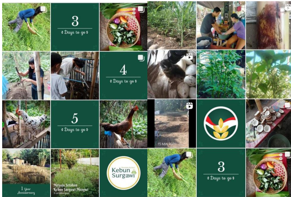
Gambar 13. Visual Konten IG ketika Diambil Alih oleh Mitra Pengkebun