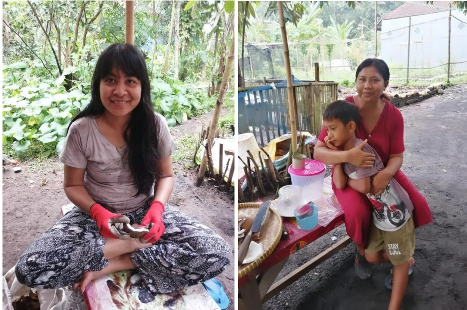
Gambar 3. Pemilik dan Penggarap Kebun Surgawi Mengwi, Bali