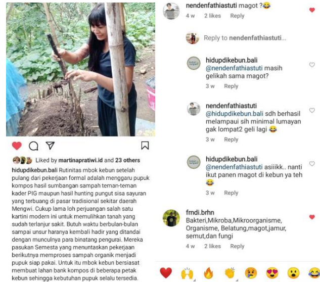
Gambar 11. Interaksi antara Admin IG dengan Follower