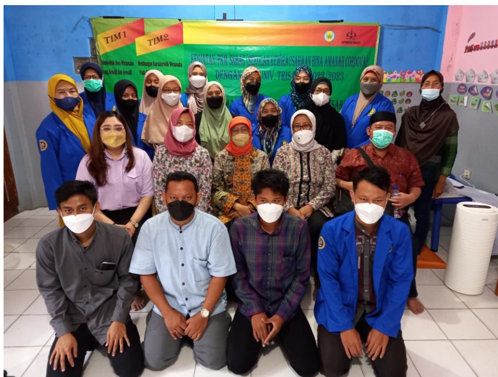
Gambar 5. Foto Bersama Setelah Pelaksanaan Pelatihan dan Diskusi antara Pihak FEB Usakti, Pengelola Sekolah, Serta Peserta Didik

Lalu di pada bagian akhir tahapan juga dilaksanakan diskusi dengan para peserta didik terkait dengan pelatihan yang diberikan yaitu tentang pemahaman mengenai entrepreneurship dan penanaman jiwa entrepreneur dalam menjalankan bisnis, pemahaman dalam mewujudkan hal-hal kreatif, serta pentingnya inovasi dalam bisnis. Teknologi pelaksanaan yang digunakan dengan menggunakan teknik penyuluhan, pelatihan dan pendampingan. Dokumentasi akan pelaksanaan kegiatan semua terlampir.