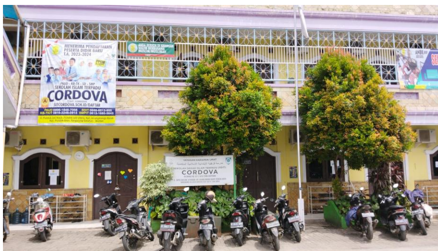
Gambar 1. Sekolah Kewirausahaan Bina Amanah Cordova

Sehubungan dengan hal tersebut di atas, dalam rangka pengembangan bisnis agar menjadi sukses maka yang paling utama yaitu adanya motivasi dari para individu pelaku bisnis. Untuk memunculkan motivasi tersebut dibutuhkan kemampuan mengelola diri agar mereka nantinya bisa siap menghadapi perubahan di masa yang akan datang. Bekal pendidikan juga sangat diperlukan untuk menambah pengetahuan terutama pengetahuan yang berkaitan dengan wirausaha. Hal ini bisa didapatkan dari berbagai sumber.