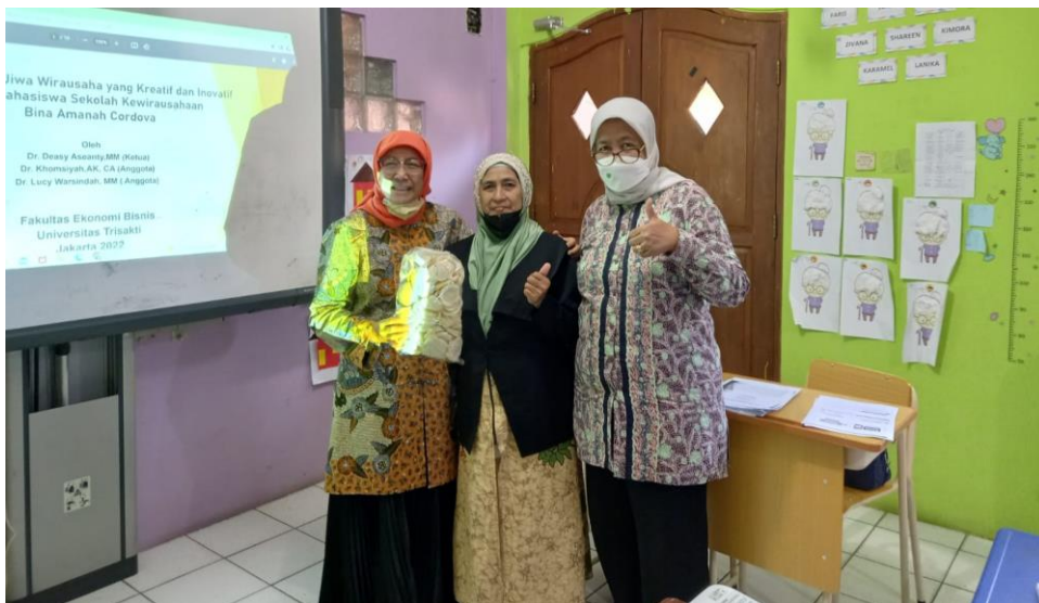
Gambar 3. Pertemuan FEB Universitas Trisakti dengan Pengelola Sekolah

Tahap awal pelaksanaan dimulai dengan pertemuan antara pihak FEB Universitas Trisakti dengan pihak pengelola Sekolah Kewirausahaan Bina Amanah Cordova yang dilaksanakan secara offline di sekolah. Acara ini dilaksanakan di bulan November 2022.