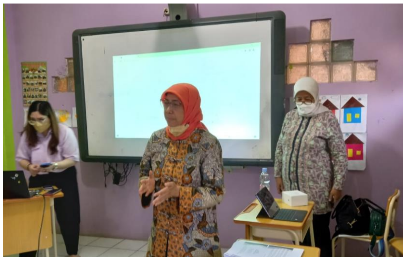
Gambar 4. Memberi Pelatihan kepada Peserta Didik Sekolah Kewirausahaan

Lalu di pada bagian akhir tahapan juga dilaksanakan diskusi dengan para peserta didik terkait dengan pelatihan yang diberikan yaitu tentang pemahaman mengenai entrepreneurship dan penanaman jiwa entrepreneur dalam menjalankan bisnis, pemahaman dalam mewujudkan hal-hal kreatif, serta pentingnya inovasi dalam bisnis. Teknologi pelaksanaan yang digunakan dengan menggunakan teknik penyuluhan, pelatihan dan pendampingan. Dokumentasi akan pelaksanaan kegiatan semua terlampir.