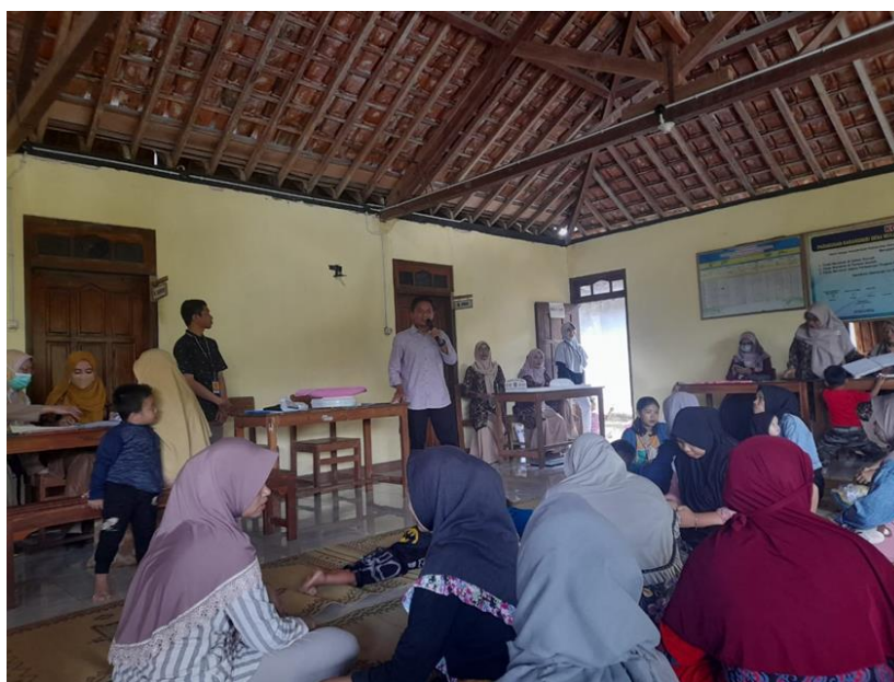
Gambar 3. Dokumentasi Sosialisasi

Oleh karena itu, memberikan penyuluhan diberikan kepada masyarakat dukuh Karangmiri, Paliyan, Mulusan, Gunung Kidul dapat meningkatkan kesadaran untuk mengurangi volume sampah melalui rumah tangga dan sebagai langkah perubahan perilaku masyarakat dalam pengelolaan sampah menuju kampung KB. Secara keseluruhan pelaksanaan kegiatan dapat berjalan dengan lancar, semua peserta aktif mengikuti penyuluhan dan bersemangat untuk mulai mengubah perilaku menjadi lebih bermanfaat. Jenis penyuluhan yang dilakukan cukup mudah untuk dipahami oleh masyarakat desa dengan sasaran ibu-ibu PKK dan kader posyandu, sehingga dapat diterima dan dilakukan dalam kehidupan sehari-hari mereka.