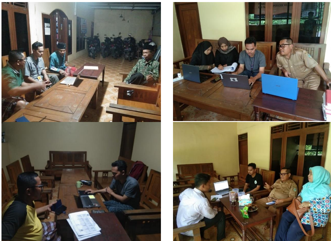
Gambar 2. Proses Update dan Pemetaan Rumah Data

Dari perbandingan pada tabel menunjukkan bahwa rumah data kependudukan dan informasi keluarga sudah tercapai sepenuhnya. Variabel penting dalam rumah data sudah dapat ditinjau seperti jumlah anggota keluarga, pekerjaan, jenis kelamin, kondisi rumah tangga, akses terhadap layanan pendidikan dan kesehatan, kondisi kesehatan bayi, akses air bersih, sanitasi dll. Rumah data juga sudah sepenuhnya diupdate untuk tahun 2023, sehingga jika ditemukan permasalahan pada anggota keluarga tersebut bisa ditangani terlebih dahulu oleh Pokja.